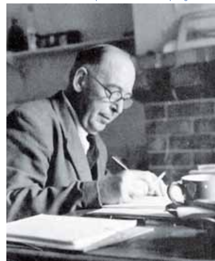
Clive Staples Lewis.

Rozhodování, v němž hlavní roli hraje strach ze smrti, je vždy špatné; naopak správné je dělat vždy to, o čem víme, že je správné, ať už to k naší smrti povede, či nikoli.