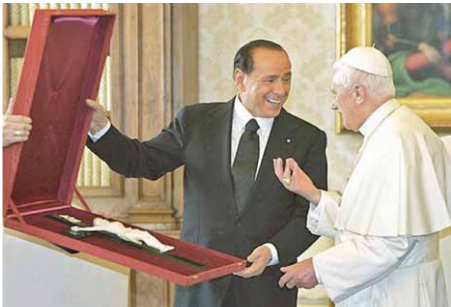
Silvio Berlusconi a Benedikt XVI.

Dialog mezi laickým státem a křesťanstvím