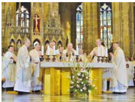
Slavnostní mše svatá k 800. výročí narození svaté Anežky České.