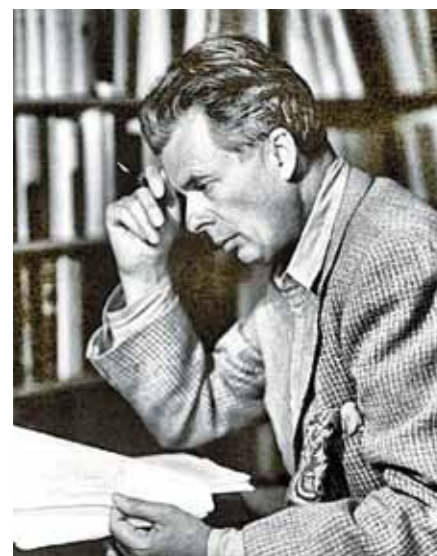
Aldous Leonard Huxley.

U Huxleyho sex naopak slouží měkké despotii udržovat lidi v poslušnosti. K sexu jsou lidé vedeni odmala, brzo, a často. Sex je totálně oddělen od lásky či rodičovství – ona despotická společnost, jak ji zobrazuje Huxley, je sterilní a děti se rodí ze zkumavky. Sex je jen pro zábavu a smyslové potěšení. Musí být maximálně promiskuitní a nesmí být součástí stabilních vztahů. Člověk jako