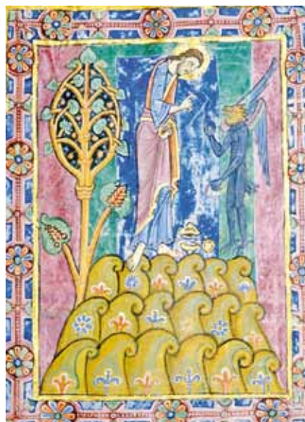
Pokoušení Krista, Žaltář ze St. Albans (1120–1145)

Dítě: Znáím to. Třeba když mě navádí, abych neposlouchal, tak mi říká: „Jsi už dost velký a víš sám nejlépe, jak se to má dělat. Rodiče ti nerozumí, nechápou, co ty potřebuješ.“ Anebo také: „Když neposlechněš, tak už jsi dospělý.“