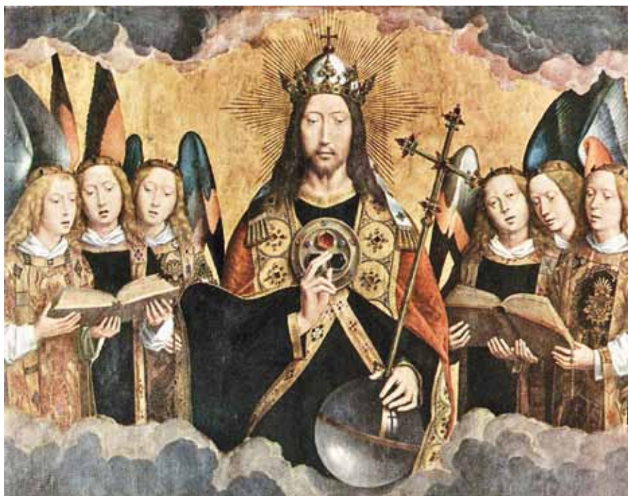
Hans Memling: Kristus král (1480).

A protože tohle všechno máme od Boha, musíme mu za všechno děkovat. Budiž mu sláva na věky věků. Amen.