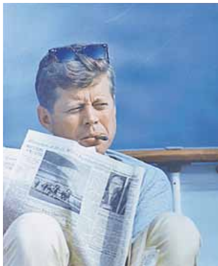
John Fitzgerald Kennedy.