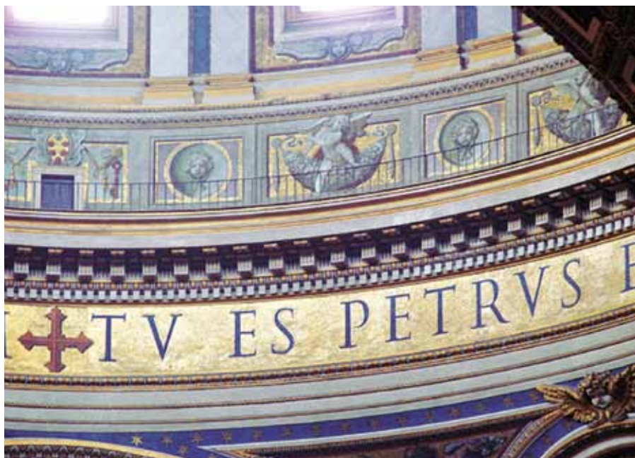
Tu es Petrus... Bazilika sv. Petra v Římě.

Církve ve prospěch cesty, pro niž neexistuje ani přesvědčivá obhajoba, ani ji nezastává většina. Za tohoto papeže definitivně nedojde k žádnému oslabení. „Celibát,“ říká papež, „je veliké znamení víry, přítomnosti Boha ve světě.“ Bylo by naprostým bláznovstvím zříci se ho v době tak vzdálené Bohu, která právě takové znamení potřebuje. Nikdo se ostatně neptá samotných dotčených 400 tisíc kněží a statisíců řeholníků a řeholnic, kteří v bezvýhradném následování Krista konají obdivuhodnou práci. Již výroky o „celibátu z donucení“ jsou zavádějící a urážlivé. Ukazují na neschopnost mít ve vážnosti a úctě cenné, ba svaté „evangelijní rady“ – čistotu, chudobu a poslušnost, a lidi, kteří mají toto zvláštní povolání. Nikdo nemusí být knězem. Nikdo nemusí být hasičem. Ale když je opravdu povolán, nebude mít strach ani z ohně, ani z vody.