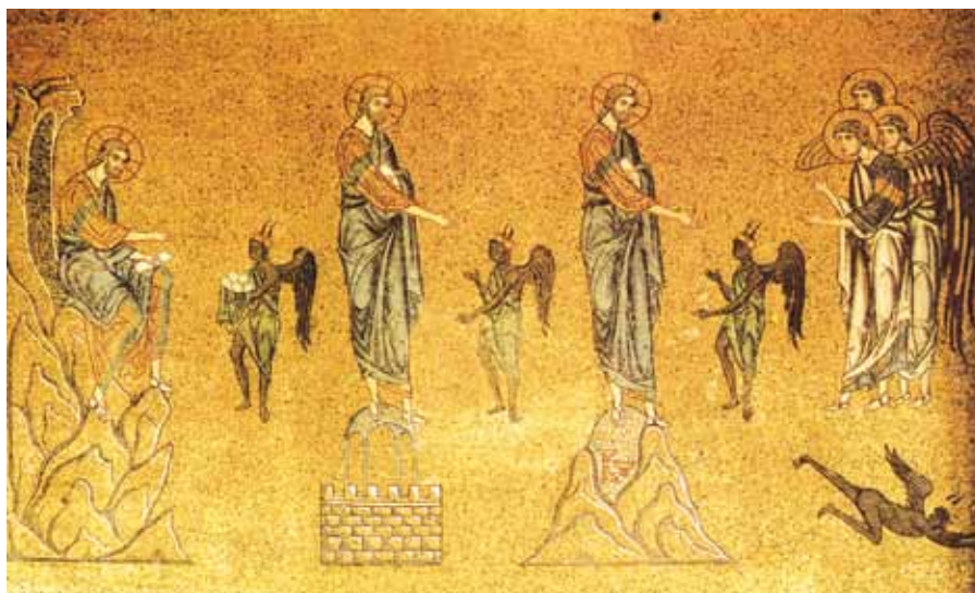
Pokoušení Krista. Benátky, bazilika sv. Marka (mozaika z 12. stol.).

Neboť lásce, kterou jsme zavázáni stejně vůči Bohu i vůči člověku, nikdy nestojí v cestě tolik překážek, že by nemohla svobodně usilovat o dobro. Podle andělských slov: Sláva na výsostech Bohu a na zemi pokoj lidem dobré vůle se každý člověk posvěcuje nejen tím, že má dobrou vůli, ale i tím, že uskutečňuje pokoj, když bližním, kteří strádají jakoukoli nouzí, prokazuje účinnou lásku.