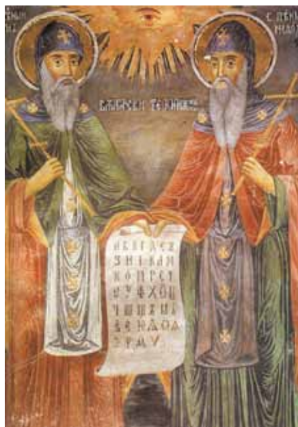
Stanislav Dospevski: Cyril a Metoděj (19. stol.)

Křesťanství není jen něco přidaného k životu, co se týká našeho soukromí. Křesťanství je celostní životní styl.