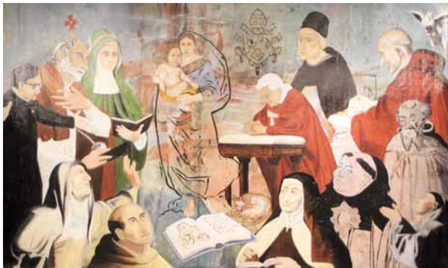
Fred Villanueva: Benedikt XVI. v modlitbě se svatými teology (2002–2008)

Západní svět je ohrožen vlastní slabostí