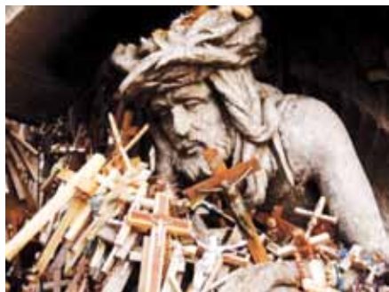
Z výstavy Hora křížů v Karolinu

Proběhl pátý ročník festivalu Mene Tekel