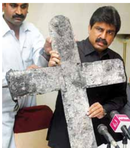
Šáhbáz Bhattí.

Náboženský fanatismus má na svém kontě další oběť. Ve středu 2. března byl zavražděn pákistánský ministr pro náboženské menšiny Šáhbáz Bhattí, jenž se snažil změnit kontroverzní pákistánský zákon o rouhání. Přinášíme rozhovor s jeho bratrem.