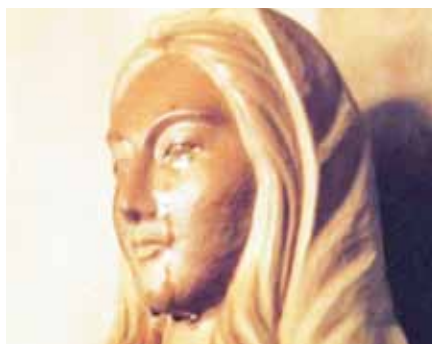
Panna Maria z Akity.

Hlavou mi jdou dramatické události posledních dnů. Myslím na město Sendai, zítra jsme tam měli hrát. Bylo těžce zasaženo. Přemýšlím, kolik z tamních obětí asi mělo lístek na náš koncert... V duchu vidím záběry japonské televize: tsunami téměř v přímém přenosu. Záběry, které obletěly svět. Trosky kam až oko dohlédne, loď na střeše polorozpadlého domu, auta zmítající se ve vlně jako krabičky od sirek. A svědectví těch, kteří zázrakem přežili: paní ve středním věku, vlna v mžiku zaplavila celý její dům, ona drží malou dcerku a snaží se dostat k oknu. Rozbíjí okno, ale při prolézání se dcerka vysmekla. Utonula. Paní se zachránila na stromě, z kterého ji po mnoha hodinách osvobodil vrtulník. Paní pláče, holčička už tady není... Nejsmutnější záběr, který se mi z paměti již nikdy nevymaže: dvě malé holčičky stojí na vyvýšenině nad troskami, které se táhnou do nedohledna. Usedavě pláčou. Ta první volá se zoufalým pláčem do trosek: „Okásan, okásan!“