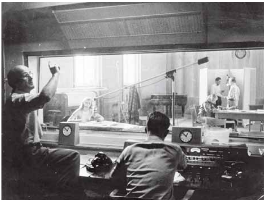
Rádio Svobodná Evropa, studio v Mnichově.