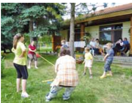
Středisko Oáza v Lidicích.