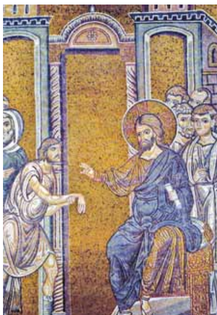
Ježíš uzdravuje člověka s ochrnutlou rukou

Rodič: Ano. A nemusí jít vždycky jenom o velké hříchy. I lehké hříchy mohou způsobit, že nám ztvrdne srdce a jsme zatvrzelí.