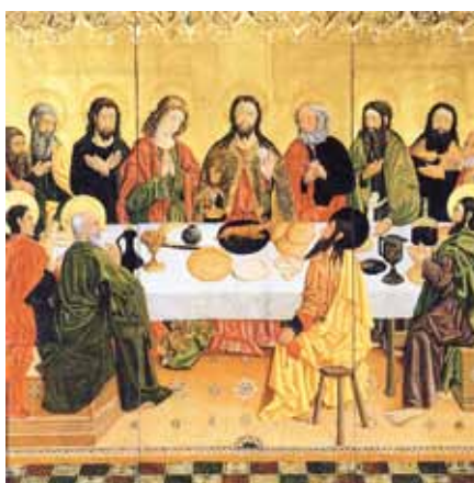
Mistr z Perea: Poslední večeře (15. stol.)

„... toto rozhodnutí znamená velkou výzvu pro všechny, kteří jsou v Církvi pověřeni výkladem Božího slova. Pro normálního návštěvníka bohoslužeb se zde totiž téměř nevyhnutelně projevuje zlom v jádru Posvátného. Bude se ptát: Znamená to, že Kristus nezemřel za všechny? Změnila Církev svou nauku? Může a smí to učinit? Není to reakce, která chce zničit dědictví koncilu? Všichni ze zkušenosti posledních padesáti let víme, jak