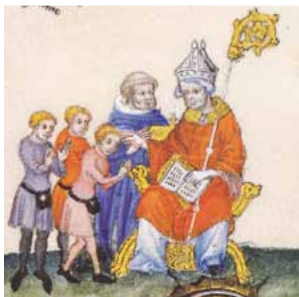
Neznámý miniaturista: Svátost biřmování (1390)

Díky viditelným posláním Syna a Ducha Svatého, která zároveň zjevují Otce, jsou dějiny spásy hluboce zakořeněny v tajemství Nejsvětější Trojice. Dvě viditelná poslání jsou odlišná a zároveň tvoří jednotu,