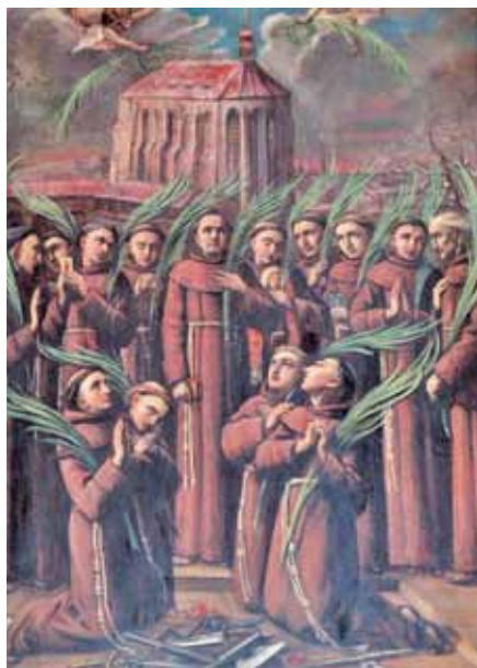
Čtrnáct pražských mučedníků.