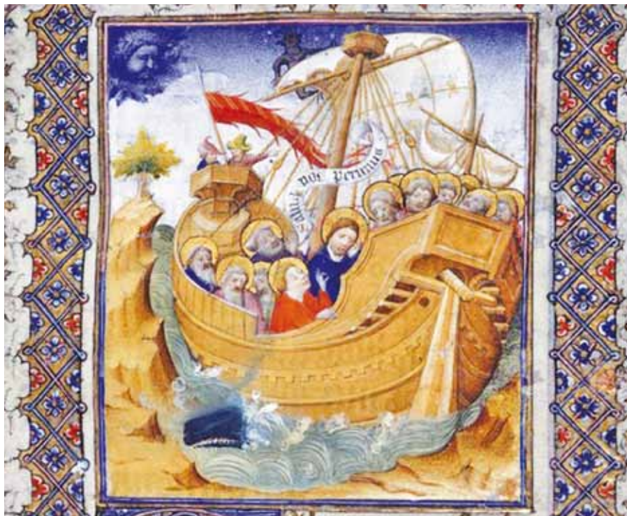
Bouře na jezeře, manuskript (1410).

Vyšetřování úniku důvěrných papežských dokumentů pokračuje