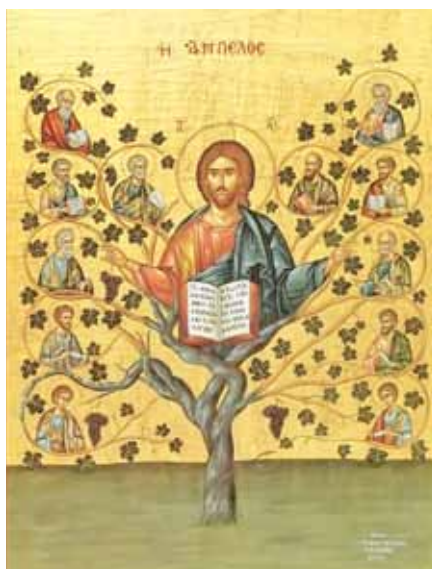
Ježíš a apoštolové.

Rodič: Jistě by se rádi radili s druhými biskupy, ale vzdálenosti byly velké. Kontakt s nimi udržovali apoštolové, kteří je na biskupy posvětili. I v Písmu svatém máme obsaženy dopisy, které psali apo-