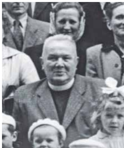
P. Sitte s farníky.

V roce 1948 byl jmenován osobním děkanem. Záhy poté se dostal do prvního konfliktu s komunistickým režimem. Manželka předsedy MNV si přála farářovo přeložení, neboť prý českým farníkům vadí jeho špatně čtená kázání. Stížnost zaslala na litoměřické biskupství, ale