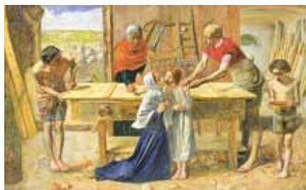
John Everett Millais: Ježíš v domě svých rodičů (1849)

Setkání nabídlo pro konkrétní politická řešení několik zásadních východisek. Hodnota práce je, jak jsem již uváděla, posuzována podle jejího zaměření na blaho bližních, nikoli podle tržního ocenění. Z toho vyplývá, že by práce pro rodinu,