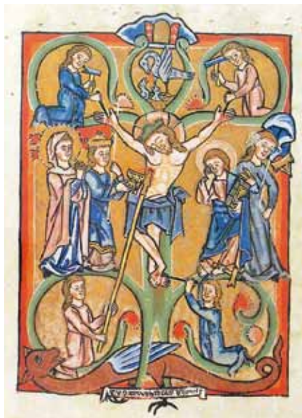
Kříž – Strom života, Scherenbergský žaltář (1260)

Dnešní člověk, tedy my všichni, který nežije kdesi, ale v nás, tento dnešní člověk nechce být nenáboženský, ale nemůže dobře nahlédnout, proč by zbožnost a náboženství měly být bezpodmínečně vázány na Církev a svátosti. Říká si: „Což nám Bůh nevytvořil krásný dóm přírody, dóm svých hor, svých lesů a svých moří, kde mohu Boha nalézt mnohem bezprostředněji, blíže a lépe, než kdybych se někde tlačil do nějakého kostela (církve)?“ A říká si: „Což není Bůh všemohoucí, copak je vázán na těch pár svátostných znamení, nebo nemůže Bůh člověka najít, kdy a kde a jak chce?“ Bůh je opravdu všemohoucí