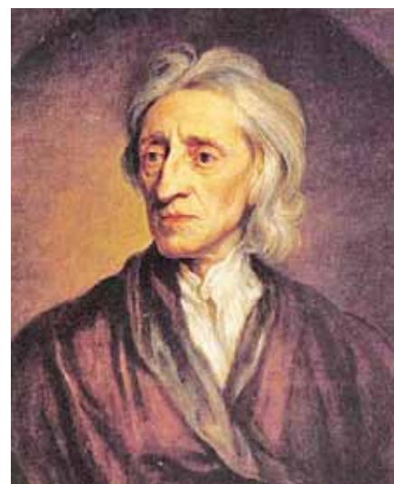
Sir Godfrey Kneller: John Locke (1697).

Locke reprezentuje praktický styl anglického naturelu. Také on chtěl vymýtit všechny plevel, který bránil jasnému filosofickému porozumění . Správně postřehl, že Descartovo racionalistické vyřazení empirie z procesu poznání je nepřijatelné. Důraz tedy položil na její opětné zařazení do hry. Nakolik byl vyvážený, budeme sledovat dále.