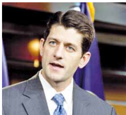
Paul Ryan.

počtu lidí příliš mnoho nových peněz do rozpočtu nepřinese. Navíc Ryan začal upozorňovat, že on nechce škrtnat výdaje jen kvůli škrtnutím, ale i proto, aby umožnil zachránit velice oblíbený program zdravotní péče pro seniory Medicare, z něhož chce část peněz Obama převést do své reformy zdravotnictví. Jinými slo-