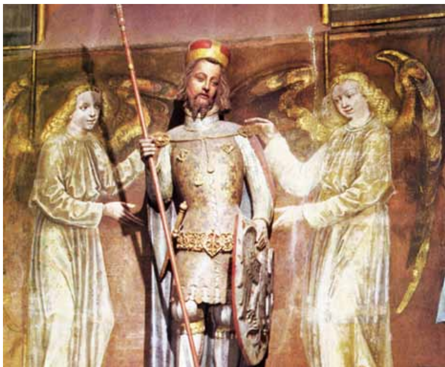
Petr Parléř: Svatý Václav (14. stol.).

Chápeš toto vítězství? Uvědom si, že se zrodilo bez jakékoli naší námahy a jakéhokoli našeho potu. Nepotřísnilo jsme své zbraně žádnou krví, ani jsme se nemuseli postavit do žádného bitevního šiku, ani jsme neutřžili žádnou ránu, dokonce jsme ani nebyli očividními svědky toho boje, a přece jsme dosáhli vítězství. Bojoval sám Pán, vítězství je naše. Jestliže je tedy toto vítězství i naším vítězstvím, napodobme vítězné vojáky a radostně zazpívejme chvalozpěv na vítězství. Chvalme svého Pána a volejme: Kde je, smrti, tvé vítězství? Kde je, peklo, tvůj osten?