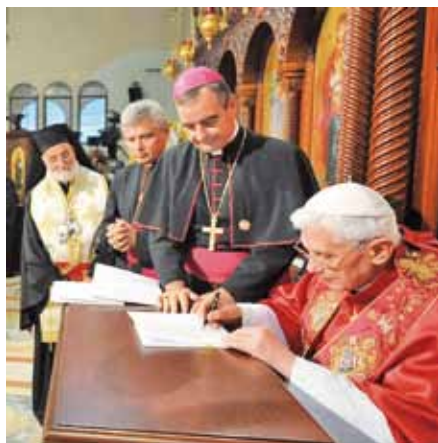
Benedikt XVI. podepisuje apoštolskou exhortaci Ecclesia in Medio Oriente .