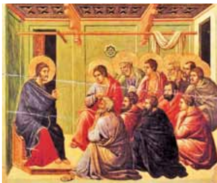
Duccio di Buoninsegna: Řeč na rozloučenou. Foto: Wikipedia

Když Pán svým učedníkům přeje pokoj (srov. Jan 14,23–29), je to především prostý pozdrav na rozloučenou od Pána, který vychází do noci Olivové hory. Hebrejský pozdrav zní, jak známo, „Šalom“, což můžeme přeložit slovem pokoj, ale také spása; v dřívějších formách pozdravu vycházejících z křesťanství lze také najít něco podobného – jako když je slovy „A Dieu – S Bohem“ zdravěn svěřován do Boží ochrany. Je to poslední pozdrav Ježíše před jeho cestou na kříž. Jedná se o něco víc než jen o nějakou konvenční prázdnou frázi. Ten, který jde na kříž, nemůže přát nějaké povrchní pohodlí. Ten, jenž na kříži zakusil až do dna propasti lidskou nouzi a přinesl světu spásu, nepřeje pokoj zapomnění, laciné pohodlí.