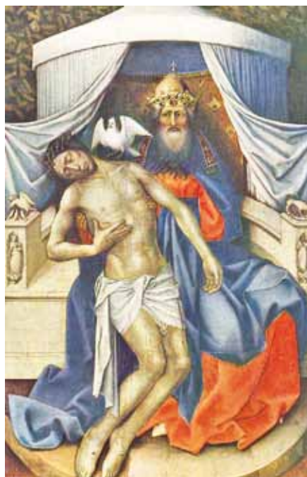
Robert Campin: Svatá Trojice (1433).