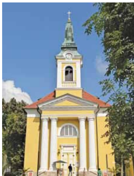
Kostel Povýšení svatého Kříže ve Františkových Lázních