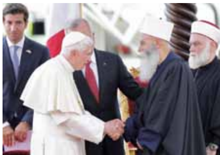
Přivítání s muslimskými představiteli na letišti v Bejrútu

Tentokrát papežské cestě žádný demonstrativní útok na Církev nepředcházel. Papež totiž beztak dobře věděl, že cesta do Libanonu představuje ohrožení života. Upozorňovali na to lidé nejlépe obeznámení se situací. Moji kolegové z rozhlasu, kteří papeže doprovázeli, dostali instrukce, že si mají nechat růst vousy, jeden z nich dokonce napsal závěť.