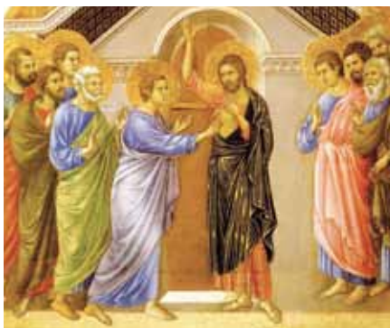
Duccio di Buoninsegna: Nevěřící Tomáš (1308).

Tím jsme se konečně dostali do bodu, kdy se můžeme ptát: Jak vlastně můžeme takovou víru získat? K tomu je třeba nejprve říci: víra není nějaká redukováná forma přírodovědy, antický nebo středověký předstupěň, jenž musí ustoupit, když přichází to pravé, nýbrž něco podstatně jiného. Není to nějaké předběžné