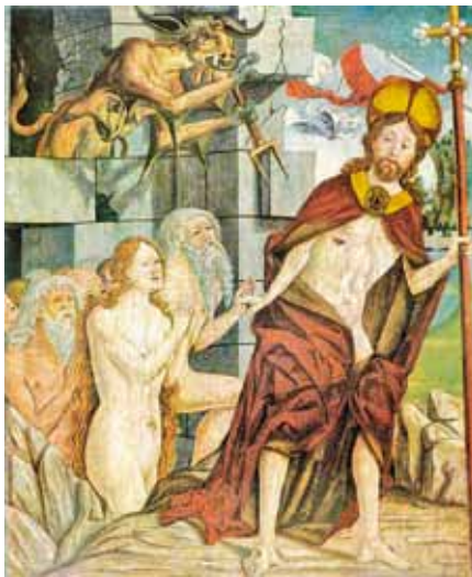
Friedrich Pachet: Kristus v předpeklí (1460)

Už dva týdny se údělem člověka, který nezná Krista, zabývají ve Vatikánu biskupové z celého světa. Na první pohled nepřinášejí debaty v synodní aule nic nového. O nové evangelizaci se