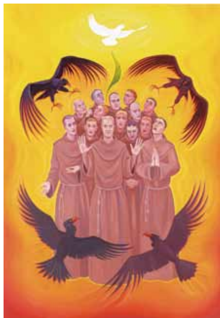
Tomáš Císařovský: Beatifikační obraz Čtrnácti pražských mučedníků.

V dějinách církve mučednictví zůstává konstantou a blahoslavenství v pronásle-