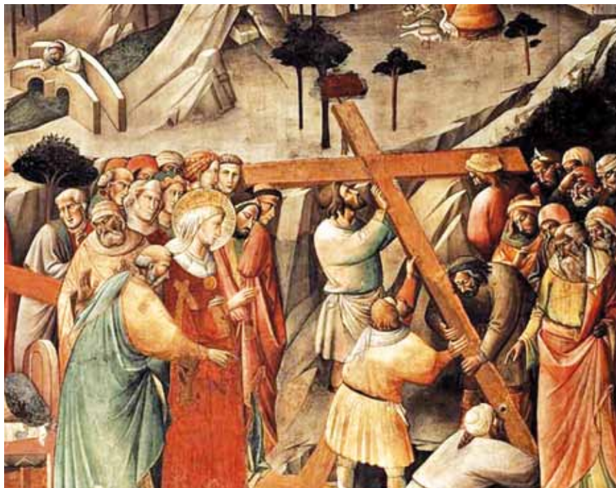
Agnolo Gaddi: Nalezení svatého Kříže, detail (1380).

Prorockými se tak z dnešní perspektivy zdají slova kardinála Wojtyły, který na Koncilu řekl, že v debatě o Bohu nemáme začínat s důkazy Boží existence, ale s „drastickými dopady osamělosti člověka“. Budoucí papež už tehdy zřejmě viděl, že zásadní otázkou je problém člověka a jeho místa ve světě. Vývoj mu dal za pravdu, protože tam, kde se změny