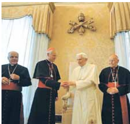
Benedikt XVI. s biskupy USA.