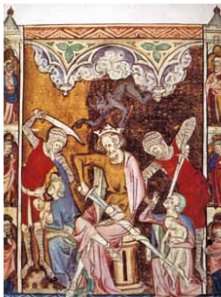
Vraždění neviňátek, Žaltář královny Marie (14. stol.)

pravo vstříc. Drtivou většinu z nich osvěta ani prevence nezastaví. Vědí vše, co vědět chtějí. Poradny nebo pomocné organizace navštěvuje také jen malé procento tohoto vzorku české ženské populace.