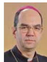
Mons. János Székely, pomocný biskup budapeštsko-ostřihomské arcidiecéze