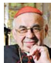
PhDr. Miloslav kardinál Vlk, český katolický duchovní a teolog, emeritní arcibiskup pražský