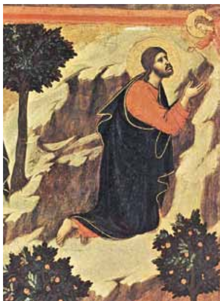
Duccio di Buoninsegna: Ježíšova modlitba, detail (1311)

Rodič: Nikdo z nás tam nebyl, takže samozřejmě nevíme, zda Ježíš při modlitbě stál či klečel anebo seděl. Ale postoj navenek vyjadřuje zase to, co se děje v srdci. Jestliže při modlitbě prožíváme velikost Boží a naši malost, tak klečeme. Pokud