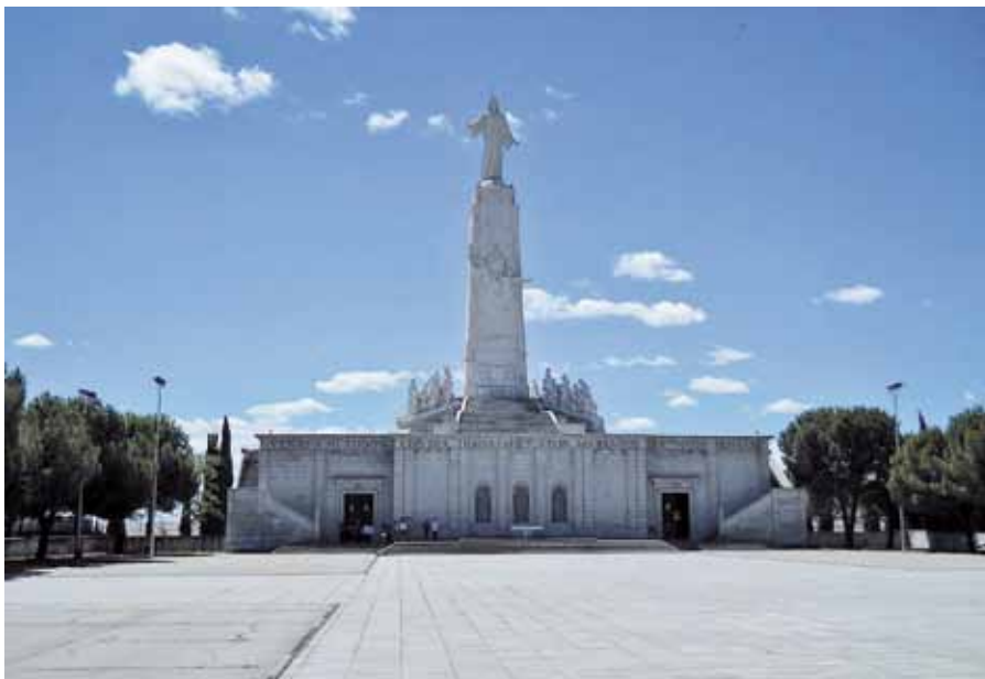
Pomník Nejsvětějšího Srdce v Cerro de los Ángeles.

K vrcholnému zjevení – zjevení, které bývá označováno jako „Velký příslib“ ( Gran Promesa ) – dochází o slavnosti Nanebevstoupení Páně ve čtvrtek 14. května 1733. Bernard prosí Nejsvětější Trojici o naplnění svých tužeb ohledně rozšíření úcty k Nejsvětějšímu Srdci Ježíšovu a náhle uslyší, jak mu ono samo říká: „Budu vládnout ve Španělsku, a to s větším uctíváním než jinde“ ( Reinaré en España, y con más veneración que en otras partes ). Tento příslib bude mít v budoucnosti významné důsledky: Nejenomže na místě, kde k němu došlo, bude postaven chrám Velkého příslibu, ale především na počátku 20. století povede k postavení monumentálního pomníku Nejsvětějšího Srdce na místě zvaném Cerro de los Ángeles , které je geografickým středem Španělska. Zde španělský král Alfons XIII. v roce 1919 zasvěti