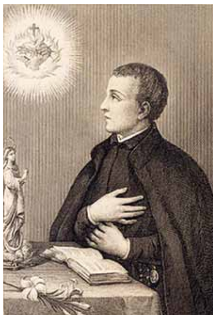
Blahoslavený Bernard de Hoyos SJ (1711–1735)

Bernard rozpoznává své řeholní povolání a ve svých patnácti letech vstupuje do noviciátu k jezuitům. Po studiích filosofie na jezuitské koleji sv. Petra a Pavla v městě Medina del Campo se ve svých dvaceti letech přesouvá do koleje sv. Ambrože ve Valladolidu, aby započal studia teologie. Za slabým tělesným zevnějškem, který vedl jeho představené k jistým váháním při jeho přijímání do řádu, skrýval neobyčejně silného a vyspělého ducha. Rychlými kroky kráčel vpřed po cestě duchovního