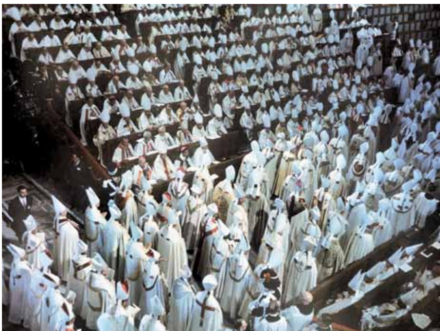
Druhý vatikánský koncil.

Benedikt XVI. na tuto otázku neodpovídá. Připomíná ovšem, že koncil nás nijak neabsolvoval od požadavku hlásat Evangelium. Spíše naopak, vybízel k intenzivnějšímu misijnímu působení. Stejného názoru byli také pokoncilní papežové, včetně v poselství citovaného Jana Pavla II., který hlásal, že pohanství a nevíra milionů lidí by v nás měly vzbuzovat trvalý neklid. My ale spíme spokojeně. Pokoncilní Církev se totiž daleko spíše než koncilem řídila takzvaným „duchem koncilu“, pro který litera nejvyššího církevního sněmu, jeho dokumenty, byly jen odrazovým můstkem k překračování stále dalších hranic v hledání novinek. Odtud také jevy, které se podepsaly na reálném oslabení evangelizace. Mám tu na mysli špatně chápaný mezináboženský dialog, vizi paralelních a v podstatě ke křesťanství alternativních cest spásy nebo dokonce idea anonymních křesťanů. To všechno stojí v zárodku podivné zdrženlivosti,