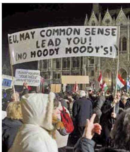
„Pochoď míru“ na podporu vlády premiéra Viktora Orbána

Jedním z těchto obvinění je Zákon o církvích. Cílem tohoto zákona je zbavit církevního statusu církev založené na byznysu. Důvodem je to, že na rozdíl od mnoha evropských zemí mají v Maďarsku církevní vzdělávací, zdravotnická a sociální zařízení zaručeno financováním státem stejným způsobem, jako jsou financovány podobné státní instituce, neboť poskytují vzdělávací nebo zdravot-