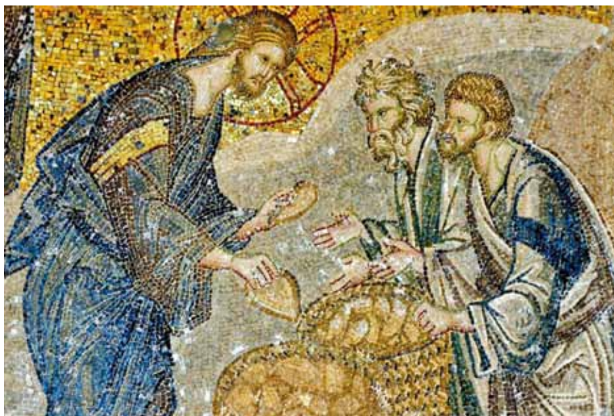
Nasyrceni zástupí (Chora, 14. stol.).

Neříkejte, praví Boží muž Jeremiáš, že jste chrám Boží. A ty také neříkej, že tě může spasit pouhá sama víra v našeho Pána Ježíše Krista. To je nemožné, musíš prokázat lásku k němu i v činech. Vždyť pokud jde o prostou víru: I zlí duchové věří, a přesto se třesou hrůzou. Úkolem lásky je z duše rád prokazovat svému bližnímu dobro, být velkodušný a trpělivý; a také užívat věcí správným způsobem.