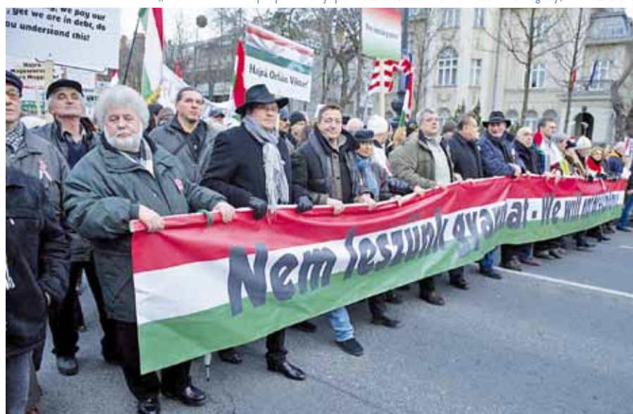
„Pochod míru“ na podporu vlády premiéra Viktora Orbána.

Není zarážející, že ty hodnoty a ideály, na něž se současná maďarská vláda „nedemokraticky“ odvolává, jsou tytéž, které před tisíciletím učinily z Uher civilizovanou a do Evropy plnohodnotně začleněnou zemi?