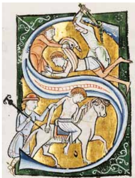
Milosrdný Samaritán, manuskript z 12. stol.

s láskou a soucitem. Co brání tomuto lidskému láskyplnému pohledu na bratra? Často je to hmotné bohatství a nasycenost, ale také upřednostňování svých zájmů a starostí přede vším ostatním. Nikdy nesmíme být „neschopní milosrdenství“ s tím, kdo trpí. Naše srdce nikdy nesmí být natolik pohlceno vlastními záležitostmi a problémy, aby před křikem chudého ohluchlo. Právě pokora srdce a osobní