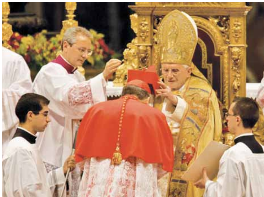
Předání kardinálského biretu.

Ostatně italská převaha v kardinálském sboru byla zachována i v nedávných dějinách Církve. Jak ukazují statistiky, nejochtější zdobil purpurem své krajany a spolupracovníky Jan XXIII. Italové představovali 44 % jeho kardinálů.