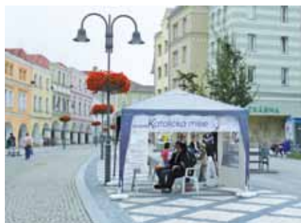
Informační stánek na misích v Krnově

Papež Honorius III. vložil řádu vlastně už do kolébky úkol sloužit především pro kázání a spásu duší. Proto je misijní poslání od života řádu neodmyslitel-