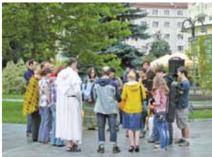
Modlitba před evangelizací na náměstí v Krnově

Jak čelit riziku, že otevřenost vůči světu nezpůsobí nákazu např. správného hodnotového žebříčku, ale opravdu povzbudí k misijní práci?