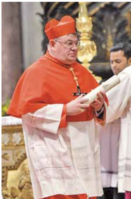
Kardinál Dominik Duka po převzetí kardinálských insignií