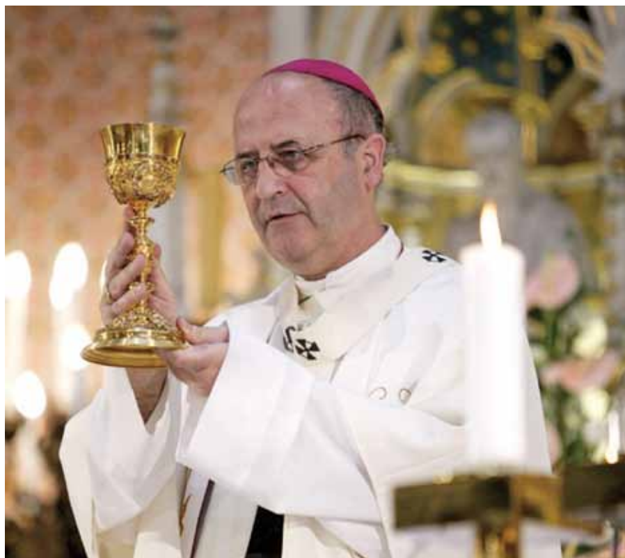
Mons. Jan Graubner.

Tyto příklady obsahují něco posvátného. Upomínají nás totiž, že nemáme považovat lidi za beznadějně ztracené a že se nemáme chovat lhostejně k těm, kteří se octnou v nebezpečí, ani nemáme být liknaví poskytnout jim pomoc, ale naopak, když se odchýlí od správného způsobu života a bloudí, že je máme přivést zpět na cestu, radovat se z jejich návratu a připojit je k množství těch, kteří žijí správně a zbožně.