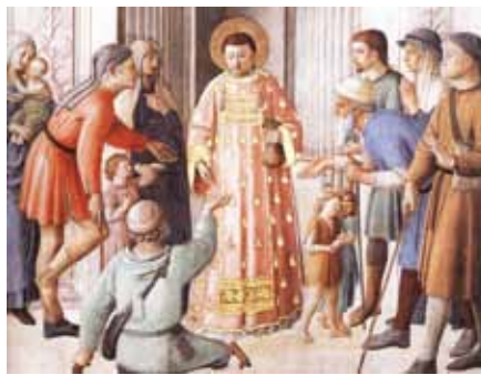
Fra Angelico: Svatý Vavřinec rozdává almužnu (1450) Foto: Wikipedia

Tento výraz z Listu Židům nás nutí k tomu, abychom uvažovali o univerzálním povolání ke svatosti a stálosti cesty v duchovním životě, abychom usilovali