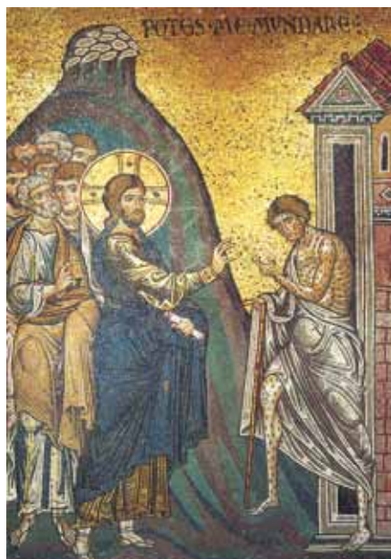
Ježíš uzdravuje malomocného (12. stol.).

Dítě: Jenomže Ježíš nemohl vejít do města, protože by ho obyvatelé prohlásili za Mesiáše, který je vysvobodí od Římanů. Přišli by vojáci, zatkli by ho a ukřižovali. Rodič: Ano, znáš to dobře. Ještě si všimni, že si Ježíš svou roli s malomocným do jisté míry vyměnil. „Zůstával venku na opuštěných místech.“ I to byl pro-