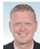
MVDr. Pavel Bělobrádek Ph.D. předseda KDU-ČSL