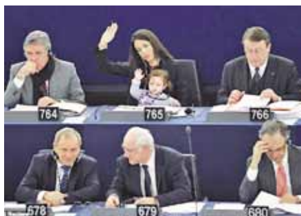
Evropský parlament se prezentuje jako prostředí přátelské rodině. Musíte ale přijmout jeho představu rodiny.