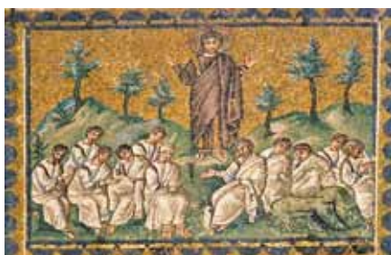
Kázání na hoře, Ravenna (6. stol.)

otevřít nový rozměr jeho jednání. Izolované a absolutizované právo se stává circulus vitiosus (bludným kruhem) ke ko-