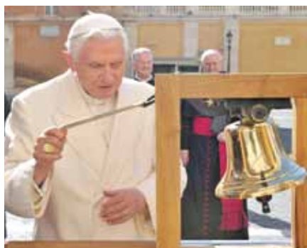
Benedikt XVI. zvoní na kongresový zvon.

Pedofilní a homosexuální skandály v irské církvi měly odezvu po celém světě a právě ty v poslední době přiměly mnoho Irů k odchodu z jejich rodné Církve.