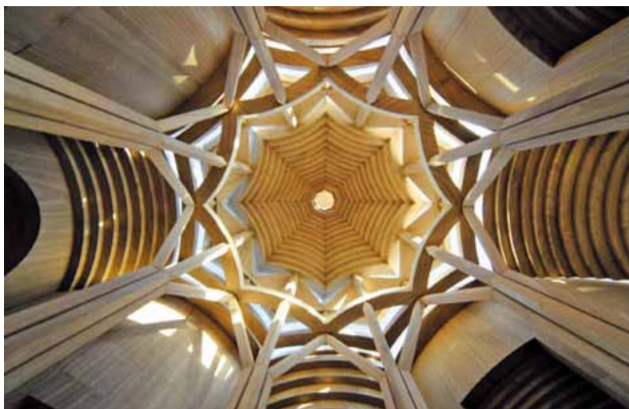
Paolo Portoghesi: Kopule kostela sv. Benedikta.

V Německu ovšem v pokoncilní sakrální architektuře převládá model zvaný