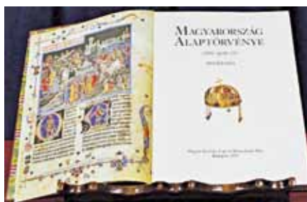
Nová maďarská ústava

Poté, co byla 18. dubna 2011 nová ústava slavnostně přijata parlamentem a podepsána prezidentem republiky, dostala se země do centra pozornosti. Na adresu Budapešti padala velmi silná slova z Bruselu i Washingtonu, vlna kritiky nabrala nový dech poté, co ústava vstoupila v lednu 2012 v účinnost. Bývalý velvysla-