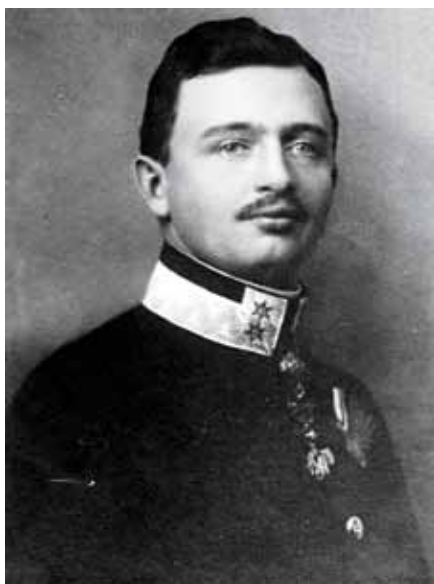
Blahoslavený Karel I. Habsburský.

Karel se narodil 17. srpna 1887 jako první syn arcivévody Oty Habsburského a Marie Josefy ze saské dynastie. Manželství Oty a Marie nebylo zrovna šťastné. Vnitřní konflikt duchovní povahy mezi