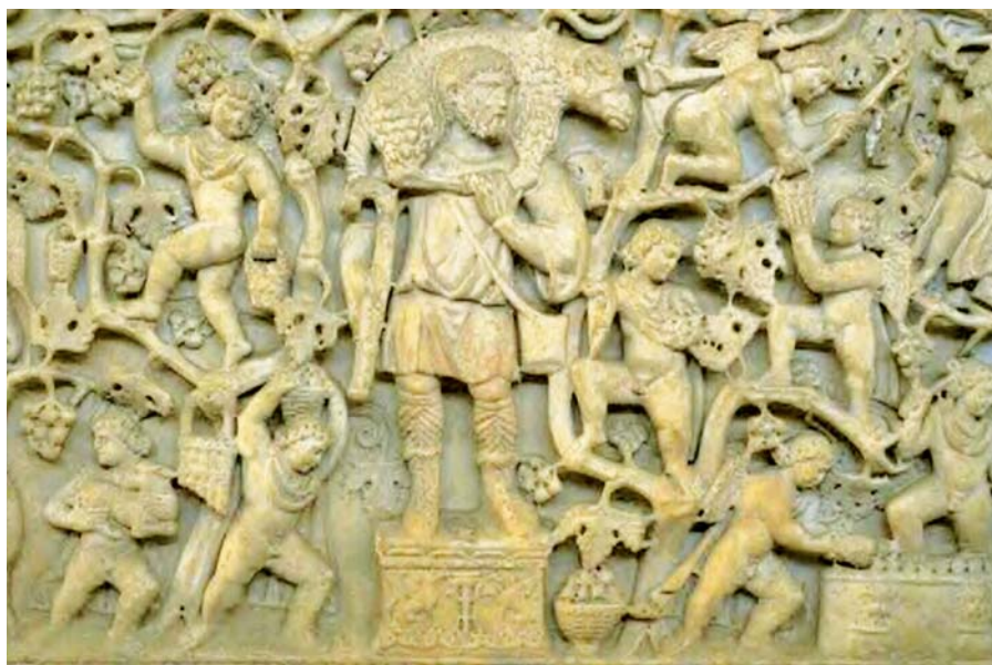
Sarkofág Dobrého pastýře, detail, Řím (390).

Když tedy ti, kteří žili ve starých zvyklostech, přešli k nové naději a nedrží už sobotu, ale žijí podle dne Páně, ve kterém také vzešel náš život skrze něho a jeho smrt. Někteří popírají toto tajemství, skrze něž se nám dostalo víry, a kvůli němuž všechno snášíme, abychom byli shledáni učedníky Ježíše Krista, našeho jediného učitele. Jak bychom my mohli žít bez něho, jehož jako učitele očekávali i proroci, jeho učedníci v duchu? Proto také přišel ten, kterého spravedlivě očekávali, a vzkřísil je z mrtvých.