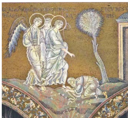
Abrahám se klaní Nejsvětější Trojici, Monreale (12. stol.)

Bůh je tudíž nejprve Otec: Bůh zná zcela dokonale sám sebe a od věčnosti – dříve než začalo zářit stvořené světlo – vyslovuje sám sebe ve Slově. Vzpomeňme na počátek evangelia svatého Jana: „Na počátku bylo Slovo a to Slovo bylo u Boha a to Slovo byl Bůh“ (1,1). Bůh tedy zná sám sebe a vyslovuje sám sebe ve Slově, neboli, ře-