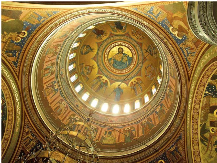
Katedrála Nejsvětější Trojice, Segešvár, Rumunsko (1934–1937).

ce, která hluboce pronikla do tajemství přebývání Nejsvětější Trojice v nás, karmelitánky blahoslavené Alžběty od Nejsvětější Trojice (1880–1906), 2 slova z dopisu její sestře, když od ní dostala zprávu o narození a křtu své první neteře: „ Pohléd na tento malý chrám Nejsvětější Trojice ve mně vzbuzuje úctu [...]. Kdybych stála před ní, padla bych na kolena a klaněla bych se tomu, kdo v ní přebývá. “ 3