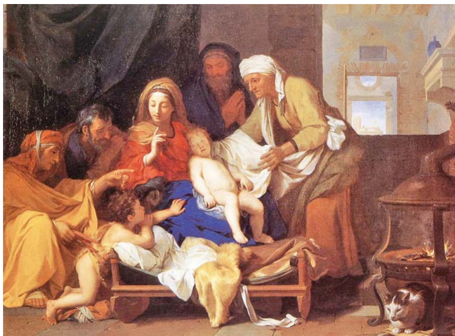
Charles Le Brun: Svatá rodina s adorací Dítěte (1655).

To není jen nějaké akademické hledisko: dialog, který se orientuje pouze navenek a ohrožuje tak vnitřní rovnováhu křesťanského společenství, neunesou zkoušku faktického spolužití různých náboženství ve společném prostoru. Konkrétně řečeno, není možné, aby v propojené občanské společnosti křesťanského