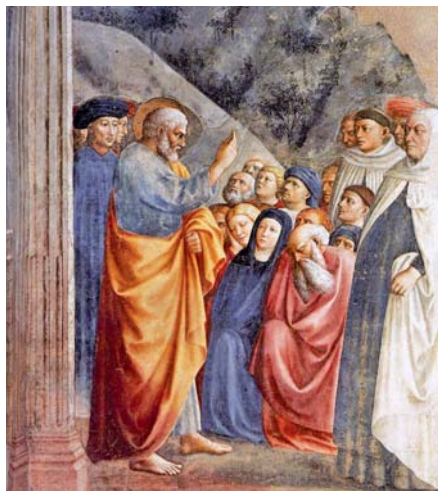
Masolino da Panicale: Kázání svatého Petra (1427)

Z čítanky „Víra Církve“ sestavené z textů Josepha Ratzingera