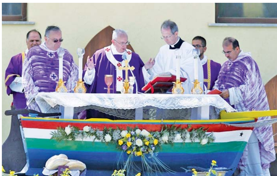
Svatý otec František slaví mši svatou na ostrově Lampedusa.

Své papežské putování zahájil papež František cestou na Lampedusu. Rychlé rozhodnutí a jen pár hodin v místě určení. Podobně jako když Benedikt XVI. objížděl místa stížená zemětřesením. Tentokrát však nešlo o přírodní katastrofu. Papež František se spěšně vydal na jižní výspu Itálie a Evropy kvůli převládající lhostejnosti k tichému dramatu tisíců lidí, kteří každoročně umírají v mořských vlnách, vydáni na pospas nepoctivým zprostředkovatelům, na přeplněných plavidlech, za nepřízné počasí.