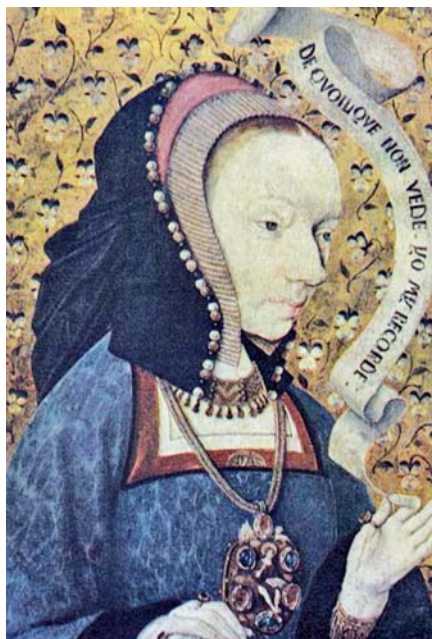
Svatá Jana z Valois.

chvíli chyběl mužský dědic (to se ale později změnilo), princezna proto byla zaslíbena teprve dvouletému bratranci Ludvíkovi Orleánskému, pravděpodobnému nástupci. Podle mnohých svědectví představovala „nepovedená“, nemilovaná dcera pro otce opravdu jen nástroj politických cílů. Neměl ji rád a dával jí to najevo.