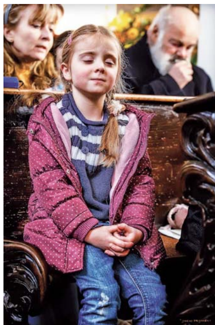
Fotografie z chystané výstavy Katedrála a živá setkání

Krásna by měla být atributem jakékoli bohoslužby. Nicméně v přítomnosti dětí se stává obrovským imperativem. Dítě není příliš schopné porozumět biblickým nebo liturgickým textům. Nemá příliš