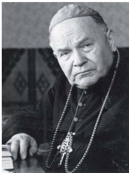
Blahoslavený ThDr. Vasiľ Hopko.

kde vedl duchovní obnovy. V roce 1931 obdržel k užívání od pražského arcibiskupa F. Kordače kostel sv. Klementa, který přizpůsobil pro východní obřad. Zde byla také zřízena samostatná řeckokatolická farnost, do níž patřili řeckokatolíci