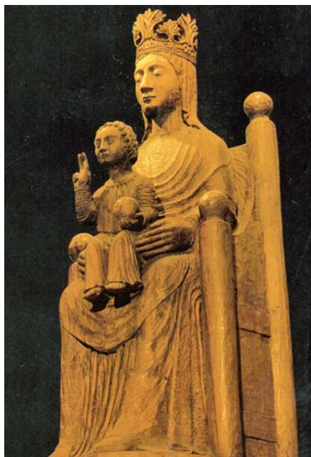
Sedes sapientiae (12. stol.).