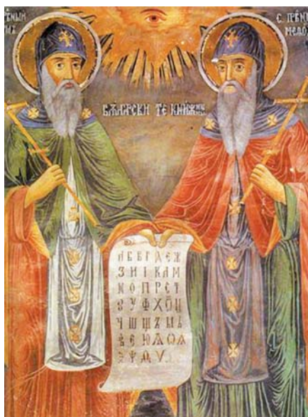
Zahari Zograf: Sv. Cyril a Metoděj (1848).

aplikovat, co říkal Benedikt XVI. V oblasti druhé to zdaleka není tak jednoduché, neboť tam jde o zprostředkování vědeckých poznatků k prohloubení víry. Přicházím ze země, v níž došlo k jinému vývoji než na západě Evropy. Všechno je u nás komplikováno nejprve zastavením vývoje, vývojem jiným směrem a pak