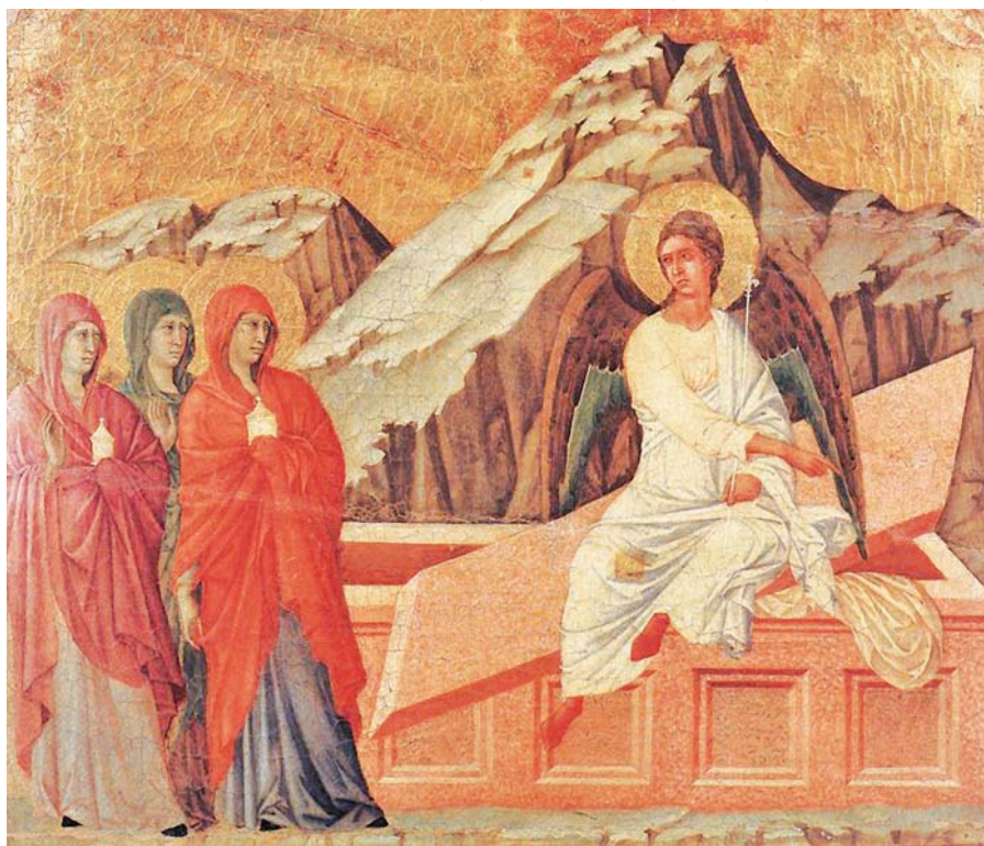
Duccio di Buoninsegna: Tři Marie u hrobu (1308–1311).

Radost z poznání, že Ježíš je živý, naději, již srdce překypuje, nelze zadržovat. Mějme odvalu „vydat se“ a vnést tuto radost a toto světlo na všechna místa svého života.