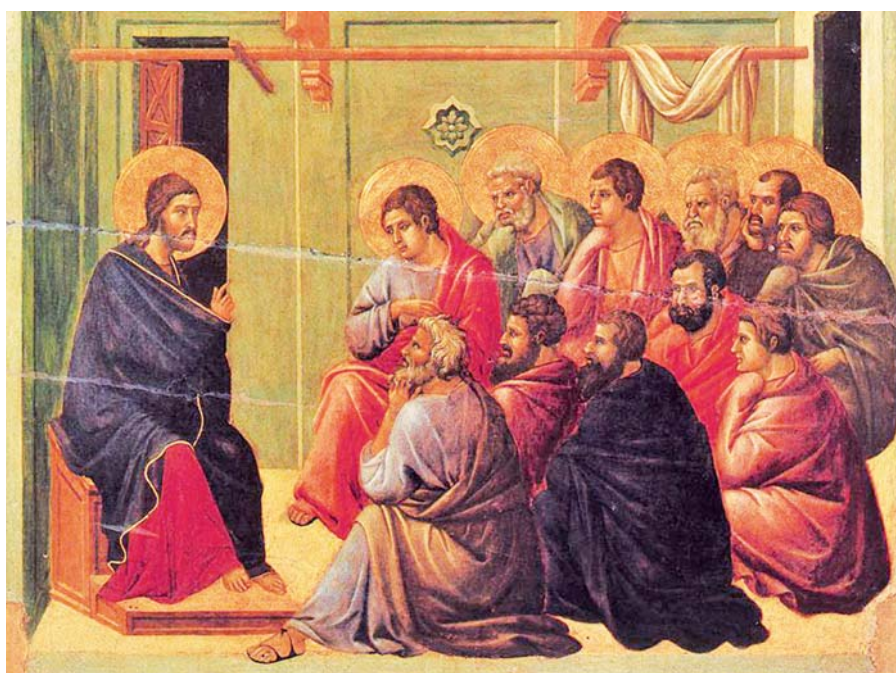
Duccio di Buoninsegna: řeč na rozloučenou (1308–1311).

Nakolik můžeš, a právě proto, že můžeš, zhoj naše rány.