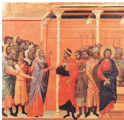
Duccio di Buoninsegna: Kristus je obviňován farizeji (1308–1311).

tvrzením, že dosáhl nemalého úspěchu také mezi pohany. Přitom je ovšem zapotřebí nezapomenout, že samotná Pravda měla a má úspěch mnohem větší, a to bez intrik a korupce.