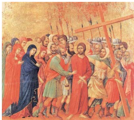
Duccio di Buoninsegna: Cesta na Kalvárii (1308–1311)

Z čítanky „Víra Církve“ sestavené z textů Josepha Ratzingera