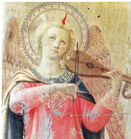
Fra Angelico, Anděl s houslemi (1433)

Ač to vypadá, že stále jen překládáme onen naznačený rozpor do jiných termínů, není to tak. Víme (hlavně z oblasti výtvarného umění), že jednou z podstatných schopností opravdového umění je překonávat rozpory, a to i takové, které jsou zdánlivě neřešitelné. Nezávisle