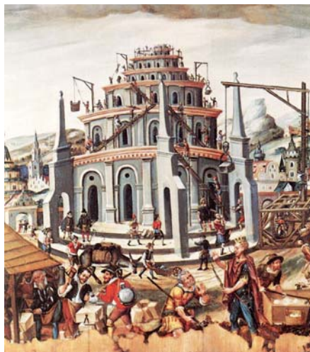
Babylonská věž, neznámý německý mistr (16. stol.)

Z čítanky „Víra Církve“ sestavené z textů Josepha Ratzingera