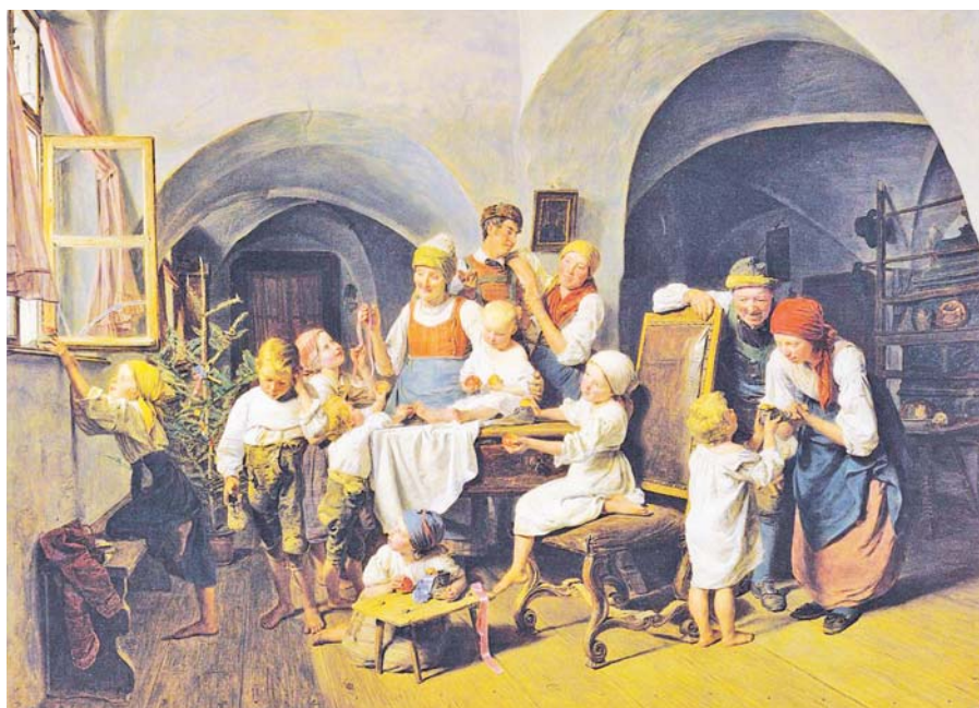
Ferdinand Georg Waldmüller: Ráno Štědrého dne (1844).

někde jinde. Nakonec jsem si vzpomněl na e-mail z února roku 1993. Tehdy jsem Vám poslal novou definici sociálního kapitálu. V e-mailu z 25. února 1993 jste příjem zasláního materiálu potvrdil, ale pak už nic nenásledovalo. Mohu jen hádat, že jste novou definici sociálního kapitálu přečetl a odložil bez povšimnutí. To byla zásadní chyba.