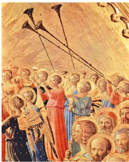
Fra Angelico: Korunování Panny, detail (1434–1435)

na hovadiny“ v sobě zahrnuje i „nemyslet na nic“, k čemuž může nevhodná hudba sloužit. Jsou lidé – nejen duchovní správci –, pro něž hudba, konkrétně zpěv, je nástroj, jak věřící přinutit k tomu, aby vyslovované texty neodmleli resp. neodbreptali. Je to jistě užitečné, ale neměl by to zdaleka být jediný cíl liturgické hudby. Bohu dlužíme mnoho a při mešní liturgii bychom tím měli přímo explodovat. To není nemístný idealismus či maximalismus, to je realita, a když věc promyslíme, dojdeme k závěru, že pokud v tom není cíl PA, je PA zbytečné. Nebo ne?