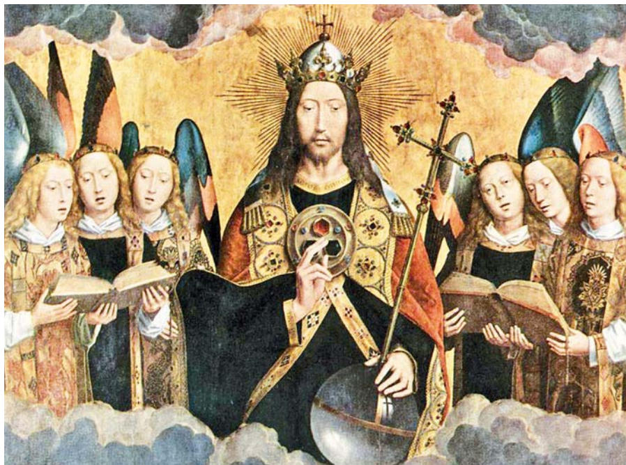
Hans Memling: Kristus se zpívajícími anděly (1480). Foto: Wikipedia

ní vzpomenou – od jednotného zvolání „Zdar, soudruhu plukovníku“? Cítíme, že liturgická hudba by měla mít cosi navíc, a že by to mohlo být právě to výše diskutované „něco jiného“. Ale co?