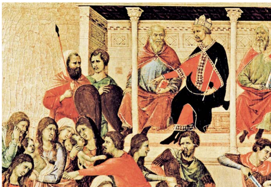
Duccio di Buoninsegna: Maestà, detail (1308–1311).

Milovaní bratři, jaká to tajemství jsou skryta v modlitbě Páně, jak mnohá a jak veliká! Jsou shrnuta do několika slov, avšak co je v nich duchovní síly! Všechno, oč máme prosit a se modlit, je obsaženo v tomto stručném Božím návodu. Pán praví: Vy se modlete takto: Otče náš, jenž jsi na nebesích .