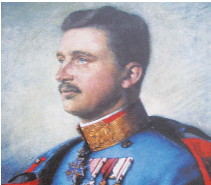
Blahoslavený Karel Rakouský.

Aby se to všechno i v nás vyplnilo, nebo aspoň plnit začalo, kéž nám dá tvoje milost, náš Pane Ježíši Kriste. Budiž ti sláva na věky.