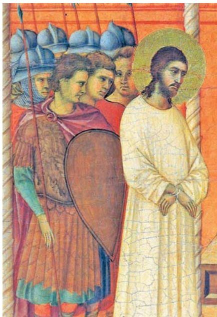
Duccio di Buoninsegna: Kristus před Pilátem (1308–1311).

pro celou společnost, tam je autenticky uplatňována a rozvíjena náboženská svoboda. Ta se pak jeví nejenom jako prostor legitimně nárokováné autonomie, ale také jako určitý potenciál obohacující lidskou rodinu svým postupným uplatňováním. Čím více sloužíme druhým, tím jsme svobodnější!