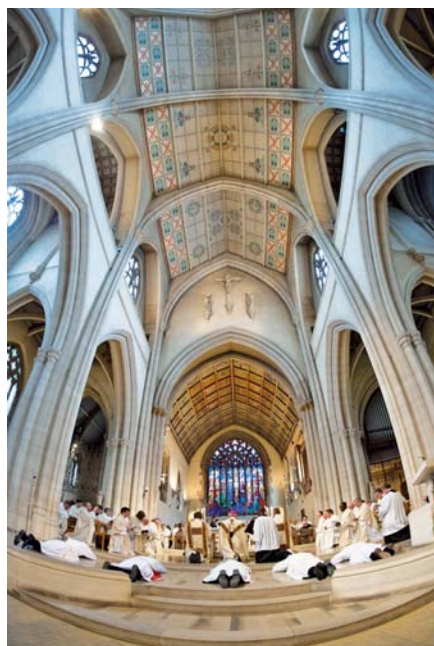
Kněžské svěcení.

Je zjevnou skutečností, že Pavel těmito slovy apeluje především na biskupy a kněze. Navíc i on sám uskutečňoval tento ideál.