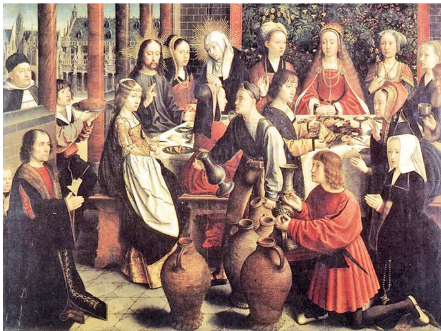
Gerard David: Svatba v Káně (cca 1500).

Jak dnešní rodině hlásat krásu evangelia