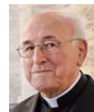
Walter kardinál Brandmüller (*1929), německý církevní historik, bývalý předseda Papežského výboru historických věd