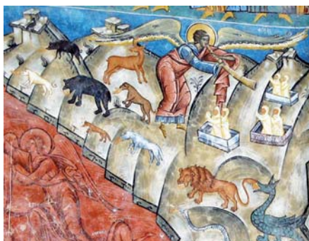
Vzkříšení (Voronetský klášter, Rumunsko, 1547)

Z čítanky „Víra Církve“ sestavené z textů Josepha Ratzingera