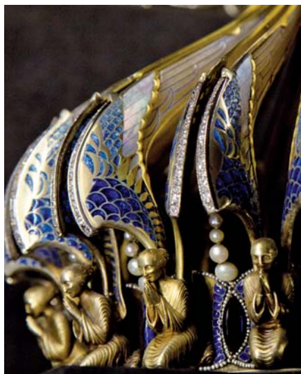
Detail secesní koruny, Notre Dame, Paříž

Čtvrtá klíčová myšlenka po jednoduchošti, srozumitelnosti a společenství, myšlenka, která se tentokrát nevyskytuje ani tak v koncilové konstituci o liturgii nebo nějakém oficiálním textu jako u komentátorů, kteří se ujali úlohy vykládat re-