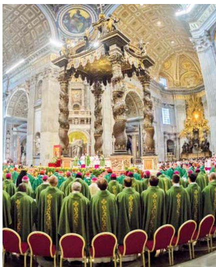
Mše svatá na zahájení synody

Ze všeho nejdříve je třeba říct, že synoda je ovlivněna emotivistickým, subjektivistickým a terapeutickým duchem. Zaznívají tam výzvy k „naslouchání“ a mnoho výzev k širšímu „dialogu“. Dokument hovoří o manželství tak, že umožňuje manželům hledat „způsoby, jak růst“. V dokumentu je zmínka o rozdílu mezi předpisy a „předkládáním hodnot“. Ne třeba dodávat, že to první je mlčky zavrženo, zatímco to druhé prosazováno. A pravidelně se zde užívá tvrzení, že mění se doba silně komplikuje situaci, a tak se nemůžeme „spokojit s teoretickým smyslem nebo obecnou orientací“.