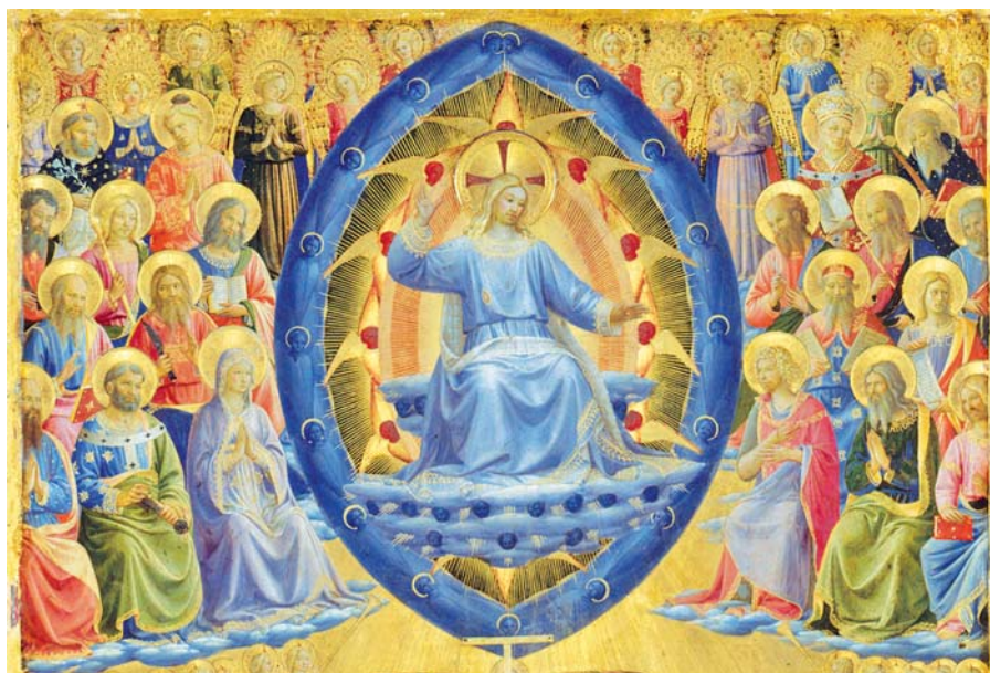
Fra Angelico: Poslední soud, detail (1450).

Je tu však jiný prvek, který nás dále posiluje a otevírá naše srdce. Jan nám říká, že v Církvi, Kristově Nevěstě, se zviditelňuje „nový Jeruzalém“. To znamená, že Církev kromě toho, že je nevěstou, je povolána stát se městem, které je povytce symbo-