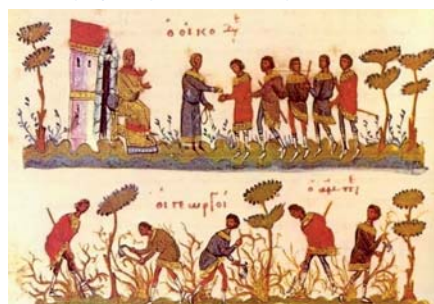
Podobenství o dělnících na vinici (Řecký manuskript)

Pokoušení chtivosti se vyskytuje neustále. Nacházíme je také ve velkém Ezechiellově proroctví o pastýřích (kapitola 34). Chtivost peněz a moci. Aby ji ukojili, nakládají špatní pastýři na bedra lidí nesnesitelná břemena, kterých se sami nedotknou ani prstem (Mt 23,4).