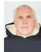
Fr. Aidan Nichols OP (*1948), dominikánský kněz a teolog, působil na univerzitách v Oxfordu, Edinburghu, Cambridge a na Angelicu v Římě

z knihy Looking at the Liturgy: A Critical View of Its Contemporary Form Přeložila Lucie Cekotová (Redakčně upraveno, mezititulky redakce) vydal Ignatius Press http://www.ignatius.com