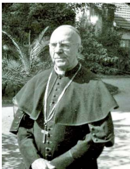
Mons. Augustin Pacha.

do Itálie a rakouské části habsburské monarchie. V roce 1906 se stal kanovníkem a konzistorním radou a obdržel od papeže vyznamenání „Za Církev a papeže“. V roce 1911 se stal diecézním kancléřem csanádské diecéze. Stál také u zrodu Banatia v Temešváru, které v roce 1926 vysvětil a jež se stalo jedním z největších německých kulturních center v jižní