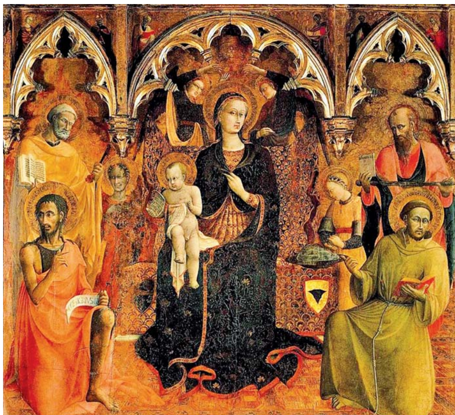
Stefano di Giovanni: Maria a Dítě se svatými (1430–1432).

A jednou nás chce přivést do stavu plnosti života ve slávě a nesmrtnosti, až nám dá žít spolu s ním a v něm slavný a věčný život v nebi.