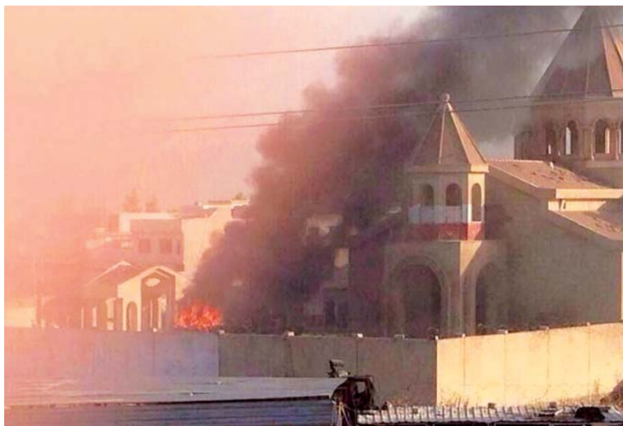
Kostel v Mosulu.

Vzhledem k výjevům, které se nám nyní vypalují do mysli, se nám jeho slova jeví jako velice mírná a veskrze rozum-