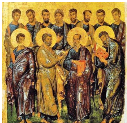
Dvanáct apoštolů (14. stol.).

Z čítanky „Víra Církve“ sestavené z textů Josepha Ratzingera