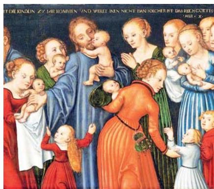
Lucas Cranach mladší: Kristus zehná dětem (ca 1540)

rokem vyhrazeným pro rozlišování. Jestliže nás tedy synoda zklamala, jestliže se jako rodiny cítíme opuštěni, jestliže nás udivují prohlášení některých biskupů na téma ústupků vůči homosexuálům, vyslovme to nahlas. Při zahájení synody