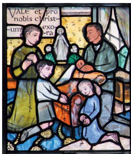
Vitřák v kostele Panny Marie Vítězné v Londýně

Svědectví rodiny je proto středem nové evangelizace. Když se Katechismus katolické církve odvolává na učení Druhého vatikánského koncilu o rodině „jako rodinné církvi“, nebo malé církvi ( ecclesiola ), 10 prohlašuje: „V současné době ve světě, který je často odcizený,