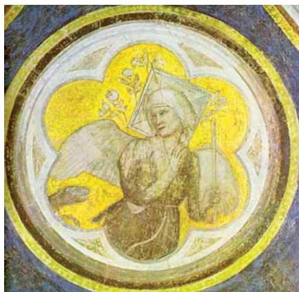
Giotto di Bondone: Čistota (1320)

Odpor proti rezignaci na slova Evangelia narůstá. Pět set kněží ve Velké