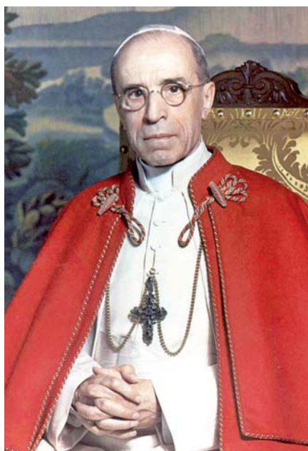
Ctihodný Pius XII.

Nejprve tak učiní na konci října roku 1942, kdy se slaví 25. výročí fatimského zjevení. Tehdy opravdové moře poutníků, které se shromáždilo ve Fatimě, naslouchá v tichosti a mnohdy na kolenu rozhlasovému poselství Pia XII. Na jeho konci papež, veden Duchem Svatým, zasvětil lidstvo a zvláště tím, i když skrytým způsobem Rusko Neposkvrněnému Srd-