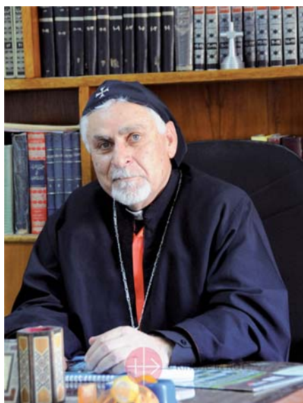
Arcibiskup syrské katolické církve Yohanna Petros Mouche.