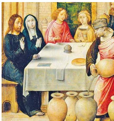
Juan de Flandes: Svatba v Káně (1496)

To, že mladí odmítají sňatek, je jedna ze starostí, které dnes vyvstávají. Proč se nechtějí brát? Proč dávají často přednost