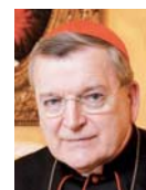
Raymond Leo kardinál Burke (*1948), americký katolický duchovní a církevní právník, patron Maltéžského řádu