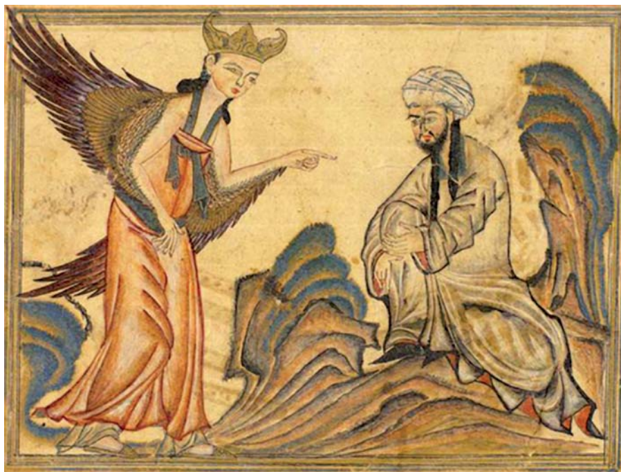
Archanděl Gabriel sděluje Mohamedovi text Koránu, perská miniatura (1307).

Když jsem se s tímto argumentem setkal poprvé, zdálo se mi, že dává smysl – aspoň na chvíli. Pak jsem si vzpomněl, že řecky také nečtu, a přesto, když čtu Homéra v překladu, dokážu obvykle odlišit pasáže, kde vypráví skvostný příběh, od částí, kde upadá. Když už jsme u toho, nečtu v ruštině, ale když čtu překlad Tolstého, dokážu ocenit krásu jeho popisů, i když si zároveň všímám toho, že tu a tam příliš rozvláčně líčí, jak rolníci na poli sklízí seno. Nemusíte umět číst francouzsky, aby se vám líbil Balzac, nebo italsky, abyste ocenili Manzoniho. Proč je arabština jediný jazyk, který nelze přeložit?