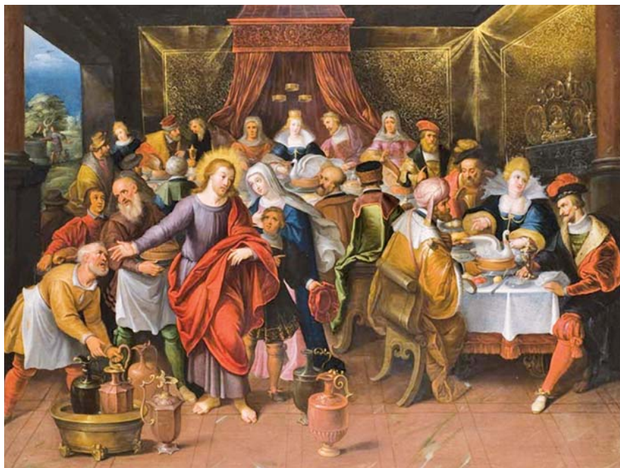
Cornelis de Baellieur: Svatba v Káně (17. stol.).

Homilie papeže Františka při mši svaté v Guayaquilu