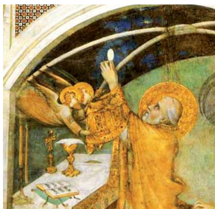
Simone Martini: Zázračná mše sv. Martina, detail (1326)

kouřem je třeba vidět líbivé a zdánlivě rozumné ideologie světa, nepřátelské katolické víře a morálce, které zasáhly oblast nauky i církevní praxe a disciplíny. (Tak například pod ideologií manželské a rodičovské zodpovědnosti se začala tolerovat nebo i schvalovat umělá antikoncepce. Pod ideologií sexuální svobody nastupují snahy uznat aktivní homosexualitu,