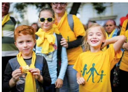
Foto na této dvojstráně: Pochod pro život v Bratislavě

lidí, ale spíše mlčení těch dobrých,“ říkával Martin Luther King. „Nakonec nebudeme vzpomínat na slova našich nepřátel, ale na mlčení našich přátel.“ Křesťanští představitelé dnes rádi citují M. L. Kinga, jehož největší frustrací však byl právě nezáměr „nic nedělajících“ křesťanských vůdců – a situace dnes je stěžejně odlišná.