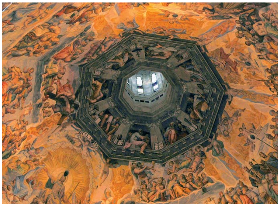
Giorgio Vasari a Federico Zuccari: Poslední soud (1579).

To je tedy oběť křesťanů: počtem mnozí, v Kristu jedno tělo. To také slaví Církev ve svátosti oltářní, kterou věřící dobře znají. V té se Církev také ukazuje, že v tom, co obětuje, se obětuje ona sama.