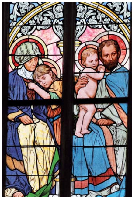
Sv. Anna a sv. Josef (chrám sv. Barbory v Kutné Hoře)

Ježíš nás vybízí, abychom nekladli překážky těmto malým zázračným gestům, a chce dokonce, abychom je vyvolávali a nechávali růst. Chce, abychom život vedli tak, jak se nám představuje, a pomáhali při probouzení těchto nepatrných gest lásky, jež jsou znamením jeho živé a čínorodé přítomnosti v našem světě.