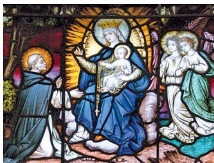
Sv. Dominik dostává růženec (Carlowská katedrála)

A pod vlivem ideologie rovnosti neboli banalizace pohlaví se rozšířil liturgický nešvar ministrování dívek a žen včetně předčitatelek Písma svatého při mši svaté a rozdavatelek svatého přijímání, a to až tak, že se v rozporu s dávnou praxí Církve