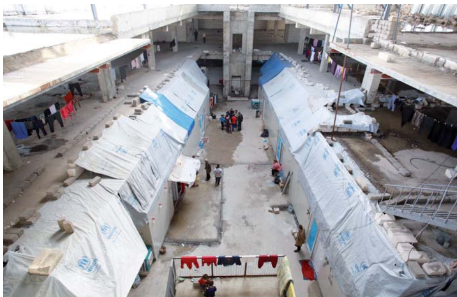
Fotografie na této dvoustraně: Uprchlícké centrum v iráckém Erbilu.

církev a za mé přátele: Ježíš nám pomáhá, abychom dokázali žít dál. Ale není to snadné.“ Půl roku poté, co přišli o všechno, kdy stále žijí ve zmatku a kdy se rodí první generace dětí v uprchlických táborech, se vysídlení křesťané ptají, kde je jejich místo na světě. Měli by čekat na další krveprolití na Blízkém východě, nebo mají opustit tento region, o kterém někteří z nich říkají, že je už dávno zklamal, a hledat nový život jinde?