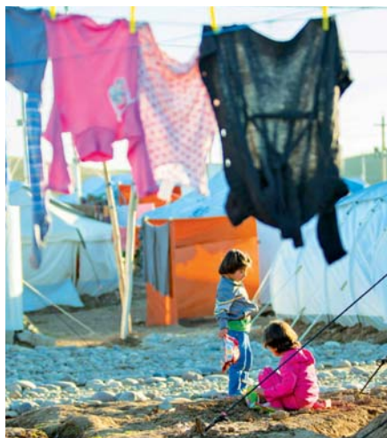
Syrský uprchlický tábor

zali pomoc v zahraničí... Ale podle mne zde nejde o elementární politické kroky a nejde zde „jen“ o politickou odpovědnost, ale také a především o odpovědnost naší katolické církve.