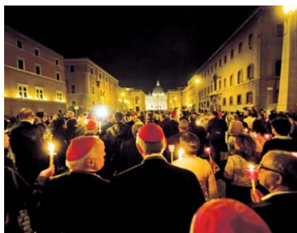
Světelné procesí k 50. výročí Koncilu.

Za prvé, nebyla to ekonomicko-sociální revoluce v klasickém marxistickém smyslu. Přesto však měla vztah ke Karlu Marxovi, ne však k tomu zralému, nýbrž k mladé-