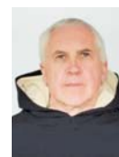
Fr. Aidan Nichols OP (*1948), dominikánský kněz a teolog, působil na univerzitách v Oxfordu, Edinburghu, Cambridge a na Angelicu v Římě

(Redakčně upraveno, mezititulky redakce) Ignatius Press, http://www.ignatius.com