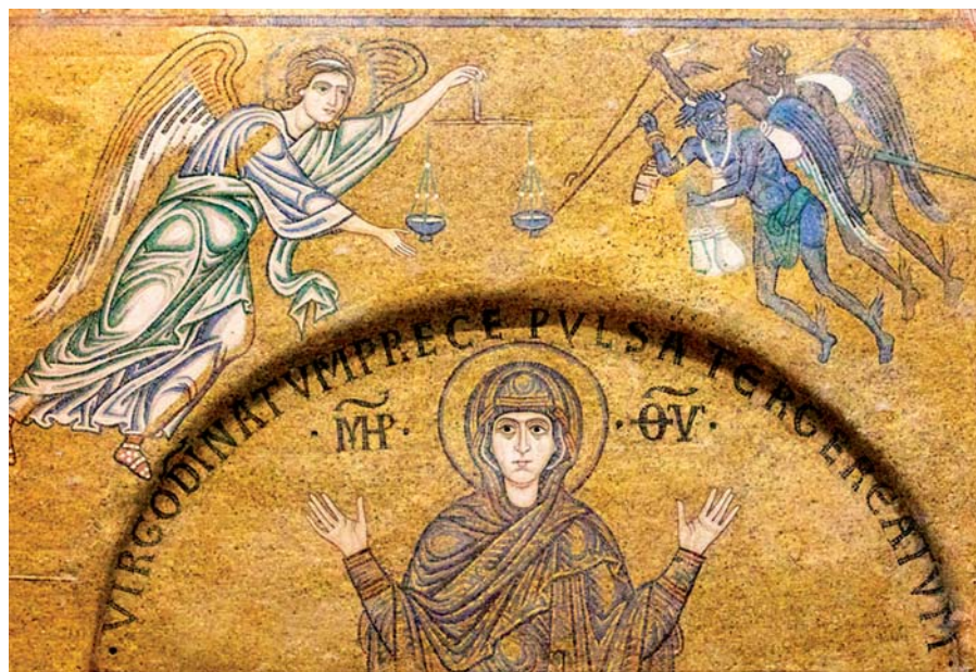
Poslední soud (12. stol.).

A stejně jako toto pomazání ničí v každém srdci, do něhož bylo vlito, nečisté duchy, tak je i nám dáno, že skrze pomazání lásky přímo vydechujeme bohu libou svornost, jak říká apoštol: Jsmo jako vonné kadidlo vydechující Krista. Takže stejně jako Bůh nalezl zalíbení v pomazání prvního velekněze Árona, je mu dobré a milé, když bratři bydlí pospolu.