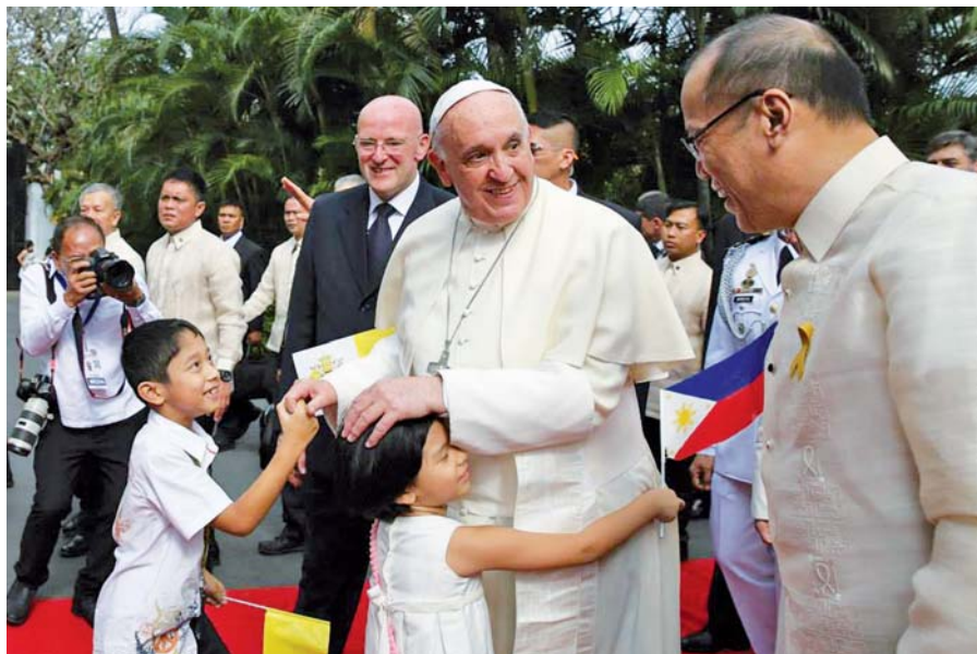
Papež František s filipínským prezidentem Benignem Aquinem.

Homilie papeže Františka při mši svaté v Manile