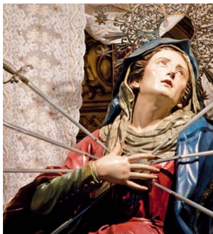
Srdce Panny Marie probodené sedmi meči

mimořádným slunečním zázrakem dne 13. října 1917, jedním z největších zázraků v dějinách Církve, kterého byly svědky tisíce lidí, tak fatimské poselství vrcholí předtím dne 13. července 1917, kdy Panna Maria odhaluje Lucii, Františkovi a Hyacintě tajemství o třech částech.