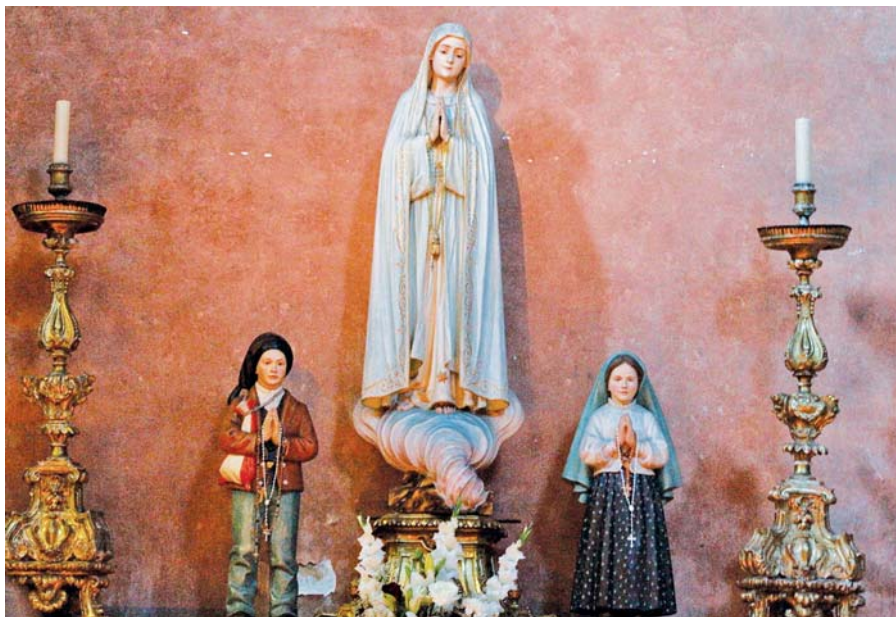
Panna Maria Fatimská, blahoslavení František a Hyacinta (kostel sv. Dominika v Lisabonu)

Pak je zde ovšem druhá, božská fáze soudního procesu, kdy případ, kauza Krista a křesťanství je nově probírána před tribunálem dějin a lidského svědomí. V této druhé fázi soudního procesu vystupuje jako účinný obhájce Krista a jeho učedníků Duch Svatý. Jeho působením se definitivní výsledek procesu mění: Ježíš a jeho učedníci se stávají vítězi a triumfují a svět je odsouzen. Žalobce se stává obžalovaným a je odsouzen. Jak říká Pán Ježíš při poslední večeři, Duch Svatý jako obhájce působí toto vítězství