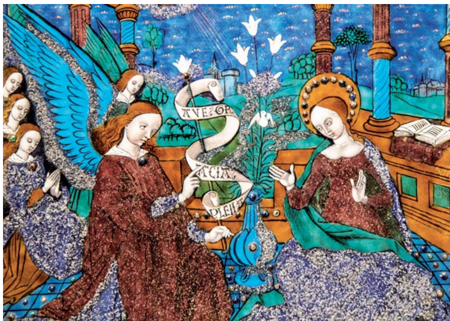
Triptych Ludvíka XII., detail (16. stol.).

My tě však milujeme láskou, k níž schopnost jsi do nás vložil ty sám. Tvá láska je ale tvou dobrotou, ty nejvyšší dobrý i nejvyšší dobro, je to Duch Svatý, jenž vychází z Otce i Syna: od počátku stvoření se vznášejí nad vodami, to jest nad zmítajícím se smýšlením lidských synů. Přitom se všem nabízí, všechno k sobě přitahuje, a neustává nám osvěcovat rozum, být na blízkou, odvracet škodlivé a opatřovat prospěšné, sjednocuje Boha s námi a nás s Bohem.