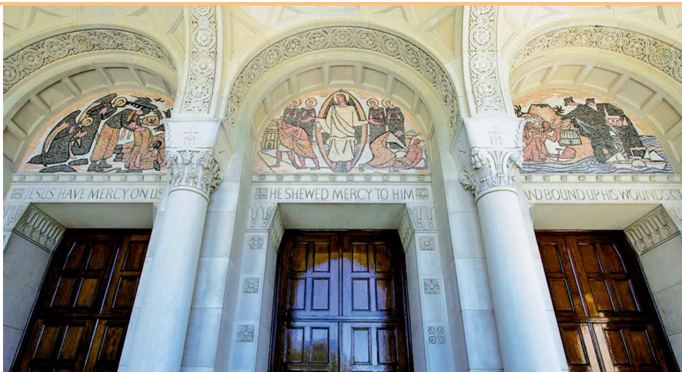
Průčelí severního transeptu Národní svatyně Neposkvrněného Početí ve Washingtonu věnované tématu Božího milosrdenství.