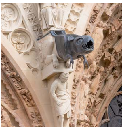
Chrlíč na katedrále v Reměši

Ta již existuje, neboť prorodinní a pro-life aktivisté jsou nekompromisně zavržováni jako zpátečníci fundamentalisté, kteří se snaží vnutit své náboženské názory „sekulární republice“. Protože se muslimové modlí v řadě ulic Paříže i jinde, evropský symbol síly, vůdkyně