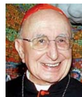
Giacomo kardinál Biffi († 11. července 2015) v letech 1984 až 2003 arcibiskup Boloni

Giacomo kardinál Biffi Congresso Eucaristico di Siena 3. 6. 1994