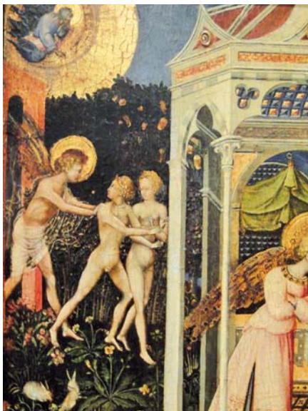
Giovanni di Paolo: Zvěstování, detail (1435)

Prvním a největším úkonem lásky, který může být prokázán člověku, je říci mu, jak se věci mají. To znamená také zjevit mu jeho vlastní identitu. Toto je první milosrdenství, které Církev uskutečňuje – má uskutečňovat – ve vztahu k lidské rodině: neodkladné sdělení pravdy. Spása našich bratrů jako taková nebu-