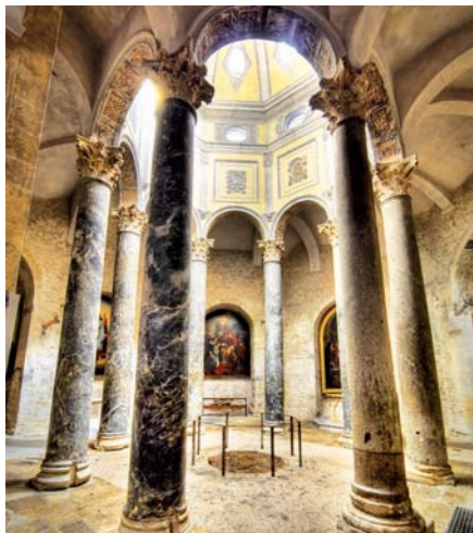
„Sloupy víry“.

Že během protimodernistického zápasu bylo ze strany kurie postupováno tu a tam nervózně a nepřiměřeně tvrdě, je ovšem politováníhodné. Když si však člověk uvědomí, že šlo o samo bytí a nebytí křesťanské víry, lze se na to dívat s pochopením. Pak přišla první světová válka, jež spolu se svými následky zabránila do hloubky jdoucímu vyrovnání se s modernismem. Po válce byla zase aktuální potřeba vypořádat se především s totalitními ideologiemi. A pak přišly zlomové politické události po druhé světové válce. To vše odvedlo hlavní pozornost jiným směrem, takže se v Církvi modernismus