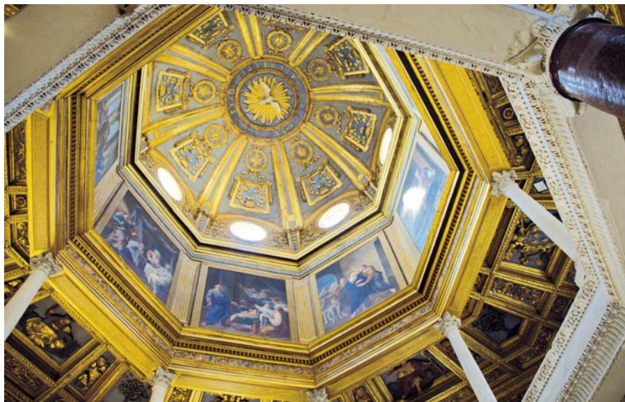
Kupole Lateránského baptisteria.

v druhé polovině minulého století. Mluvíte-li o vývoji teologické nauky, je ovšem třeba ujasnit si pojmy. Podstatné k té věci řekl kardinál blahoslavený John Newman, ve svém spisu Úvaha o vývoji křesťanské nauky (Essay on Development of Christian Doctrine) . Stručně je možné shrnout to takto: Vývoj, prohloubení, upřesnění – ano! Změna – ne! Že by v praxi a nauce Církve mohlo být dnes pravda něco, co bylo včera omylem, je nemyslitelné, věříme-li v působení Ducha Svatého, který Církve uvádí do veškeré pravdy.