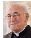
Walter kardinál Brandmüller (*1929), německý církevní historik, bývalý předseda Papežského výboru historických věd