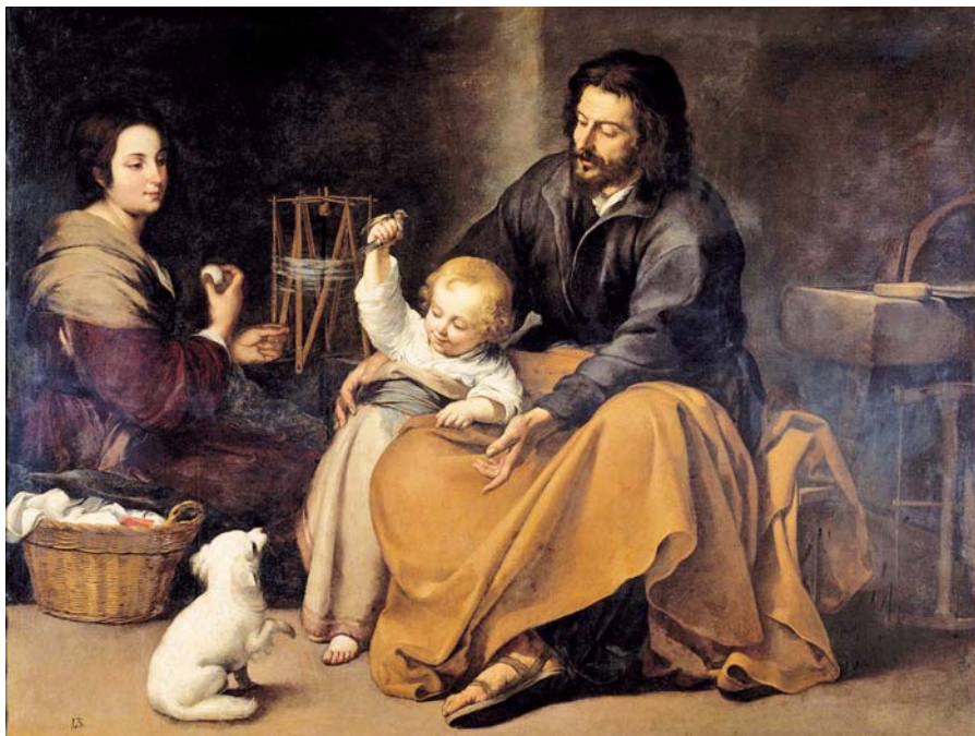
Bartolomé Esteban Murillo: Svatá rodina s ptáčkem (1650).

První nutností je tedy přítomnost otce v rodině. Aby byl nablízku manželce, sdílel všechno: radosti i bolesti, námahy a naděje. Aby byl nablízku dětem, když vyrůstají, hrají si a snaží se, když jsou lehkovážné a úzkostlivé, když se vyjadřují a jsou zamlklé, když se osmě-