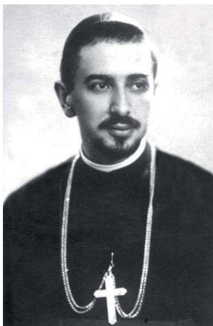
Mons. Ioan Suciú.

Ioan Suciu se narodil 4. prosince 1907 ve městě Blaj v Sedmihradsku jako čtvrtý z devíti dětí. Pocházel z rodiny řeckokatolického kněze a od dětství byl veden k víře. V rodném městě navštěvoval obecnou školu i gymnázium. Během středověkých studií byl jeho spolužákem Titu Liviu Chinezu, další z duchovních, který se stal mučedníkem komunistického režimu v Rumunsku a pojednáme o něm v některém z pokračování našeho seriálu. Ioan a Titu Liviu byli celoživotními přáteli. Poté, co složili maturitu, rozhodli se oba pro kněžství. V roce 1925 byli posláni na studium teologie na Papežské řeckokatolické kolegium sv. Athanasia při Papežské univerzitě Urbaniana v Římě. Ioan Suciu dále studoval na Univerzitě sv. Tomáše Akvinského – Angelicu a byl po šesti letech studií promován doktorem teologie. 29. října 1931 byl v Římě vysvěcen na kněze.