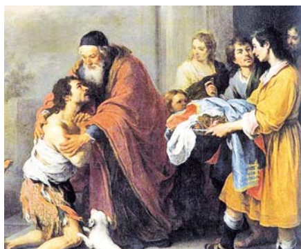
Barolomé Esteban Murillo: Návrat marnotratného syna (1670).

Chtěl bych během této společné reflexe o rodině říci všem křesťanským komunitám, že musíme být pozornější.