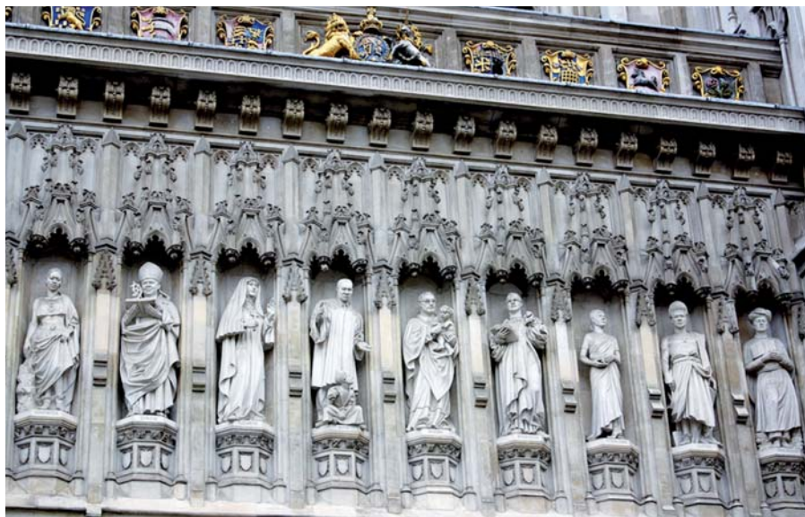
Mučedníci 20. století, Westminsterské opatství.

Už koncem devadesátých let jsme si s manželem povšimli podivné věci: kdykoli jsme mezi katolickými přáteli narazili na problém pronásledování křesťanů, ukázalo se, že většina z nich o tom prakticky nic neví. Mnozí byli překvapeni.