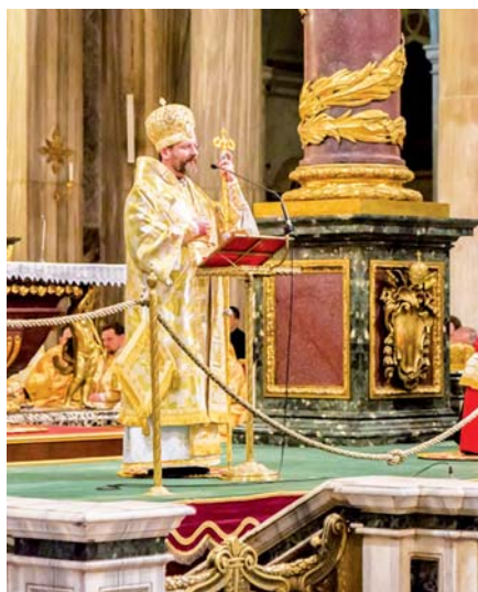
Arcibiskup Sviatoslav Ševčuk slaví liturgii v bazilice Santa Maria Maggiore