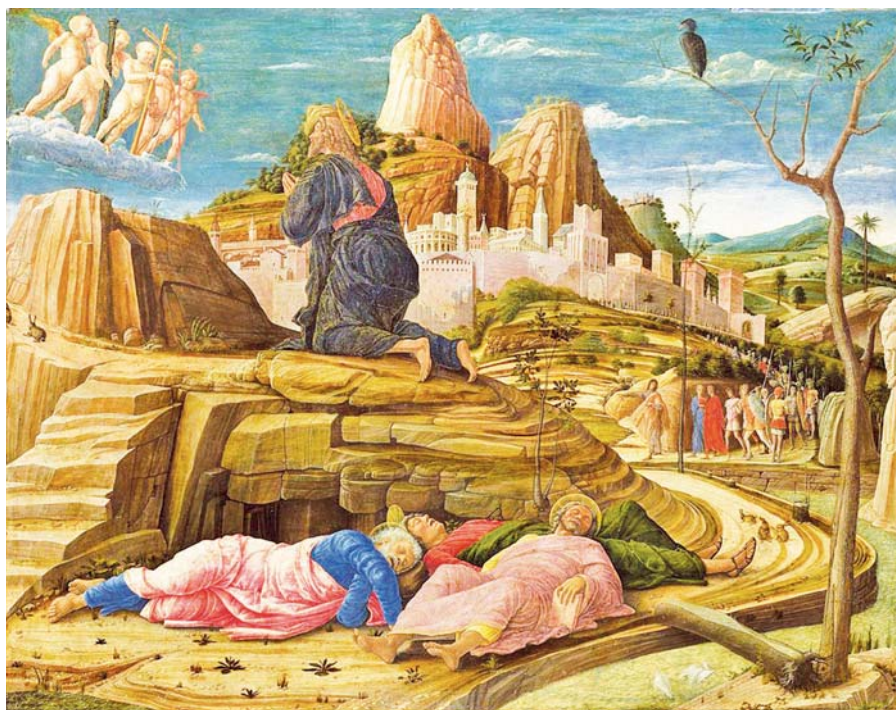
Andrea Mantegna: Agonie v zahradě (1460).

Snad se pokoušíš chodit, ale nemůžeš, protože tě bolí nohy. Proč tě však bolí? Není to tím, že je chtivost honila cestou nestou? Slovo Boží však uzdravilo i chromé. „Já mám nohy zdravé,“ namítneš snad, „ale nevidím žádnou cestu.“ On však i slepým vrátil zrak.