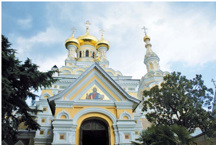
Chrám svatého Alexandra Něvského, Jalta.

s příměsí pohanských prvků), avšak ani jejich původ není zdaleka zřejmý.