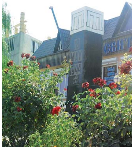
Památka deportace krymských Tatarů

Krymskými Tataři se Chruščov nijak dále nezabýval. O ně se začal zajímat až jeho nástupce Leonid Iljič Brežněv, který je v roce 1967 politicky rehabilitoval. Avšak návrat na Krym jim byl povolen až o jedenadvacet let později v období Gorbačovovy perestrojky. Na poloostrově