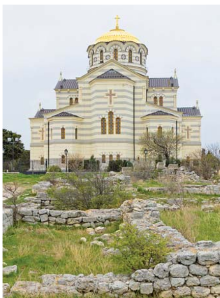
Ruiny antického města Chersónesos a chrám Sv. Vladimíra u dnešního Sevastopolu

(kmenový svaz Ostrogótů), který podle tradice pocházel z jižního Švédska a z ostrova Gotlandu. Říše východních Gótů se však roku 375 rozpadá v důsledku vítězného tažení kočovných Hunů do černo-mořských stepí. Avšak gótské knížectví přetrvalo ještě po několik století jako vazalské území pod správou nejrůznějších mocných celků. Mezi ně patřily zejména Byzanc a Chazarská říše.