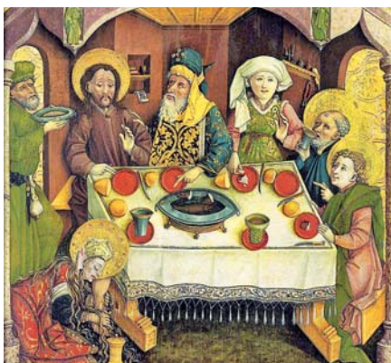
Pomazání Ježíše v Betanii (ca 1470).

tánní. Bůh jí odpouští mnoho, všechno, protože „mnoho milovala“, a ona se Ježíši klaní, protože cítí, že v něm je milosrdenství, a nikoli odsouzení. Cítí, že Ježíš ji chápe laskavě. Ji, která je hříšnicí... Díky Ježíši Bůh její hříchy odstraňuje, nevzpomíná na ně (srov. Iz 43,25). Platí totiž také, že odpouštějící Bůh zapomíná.