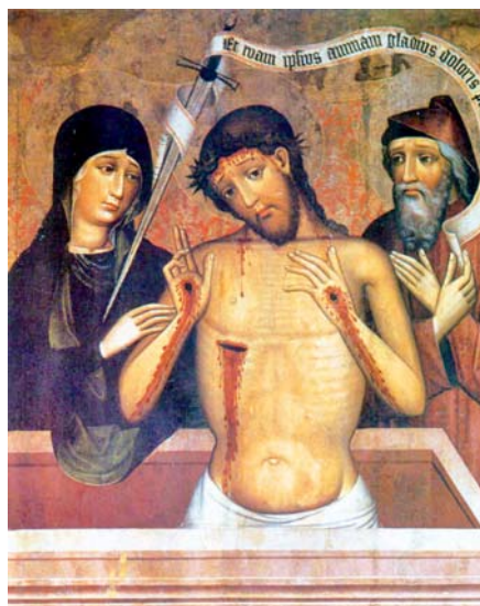
Krakovský mistr, Misericordia Domini (ca 1450)

Za pontifikátu papeže Františka slyšíme o milosrdenství na každém kroku. Rezonuje jako hlavní poselství tohoto pontifikátu. V tomto klíči je chápán. Viděli jsme to v komentářích u příležitosti druhého výročí jeho volby. Otevřenost, pochopení, bezpředsudečnost, skromnost – za to jej lidé obdivují a identifikují jej s milosrdenstvím. Problém je v tom, že v tomto mediálně přetvořeném podání se Boží milosrdenství ocitá mimo svůj