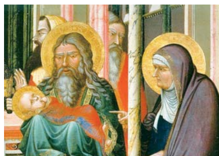
Ambrogio Lorenzetti: Obětování v chrámu, detail (1342)

Drazí prarodiče, drazí senioři, vyjděme po stopách těchto mimořádných starců! Staňme se také trochu básníky modlitby, zkusme hledat svoje slova, osvojme si ta, kterým nás učí Boží slovo. Modlitba prarodičů a seniorů je velkým darem pro