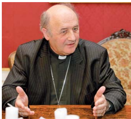
Mons. Jan Graubner.

Potěší mě každý opravený kilometr dálnice či nový objev v medicíně a mnoho dalších věcí, ale to nejdůležitější je ochota probudit se, znovu objevit stabilní rodinu postavenou na trvalém manželství matky a otce, kteří vytvářejí zázemí a jistotu domova pro děti.