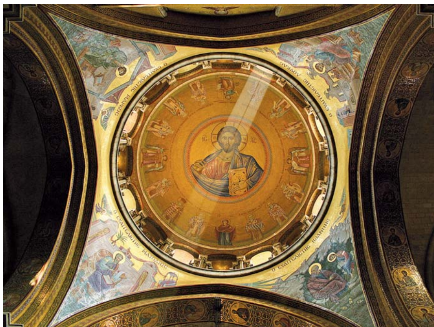
Pantokrator. Chrám Božího hrobu v Jeruzalémě.

Takže ani vy nemáte ještě v držení skutečnost, ale máte již bezpečnou naději, protože máte posvátné znamení této skutečnosti a dostali jste závdavek Ducha. A proto když jste s Kristem byli vzkříšeni, usilujte o to, co pochází shůry, kde Kristus sedí po Boží pravici. Na to myslíte, co pochází shůry, ne na to, co je na zemi. Jste přece už mrtví a váš život je s Kristem skrytý v Bohu. Ale až se ukáže Kristus, váš život, potom se i vy s ním ukážete ve slávě.