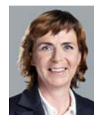
MUDr. Jitka Chalánková, lékařka a politička, poslankyně za TOP 09 za Olomoucký kraj