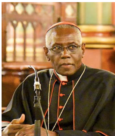
Kardinál Robert Sarah