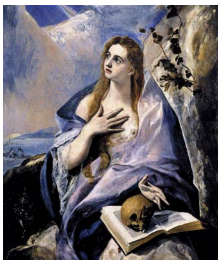
El Greco: Pokání Maří Magdaleny (1578)

Říkat, že znovusezdaní rozvedení nejsou v Církvi veřejnými hříšníky znamená předstírat něco, co není pravda. Ve skutečnosti jsou navíc všichni příslušníci Církve bojující na zemi v situaci hříšníků. Jestliže znovusezdaní rozvedení