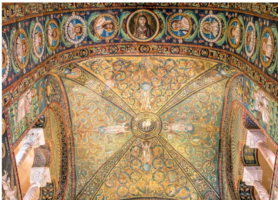
Křístus a apoštolové, San Vitale, Ravenna.

(...) Kristus Ježíš je začátek a konec, alfa a omega, král nového světa, tajemný a nejvyšší smysl lidských dějin a našeho osudu. On to je, kterého vám hlásáme pro věčnost. A chceme, aby jeho jméno zaznívalo až do končin světa a po všechny věky věků.