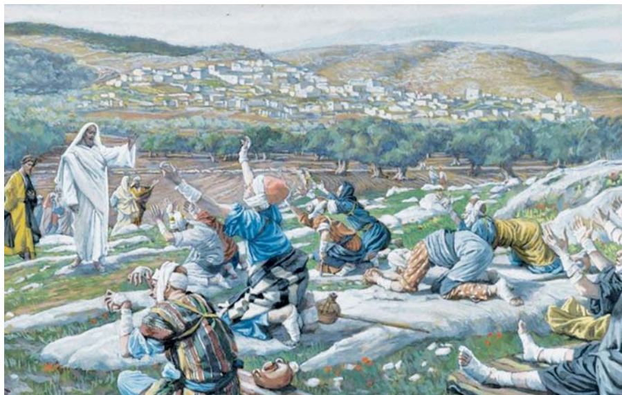
James Tissot: Uzdravení deseti malomocných (1886–1894).

Homilie papeže Františka při mši svaté u příležitosti mariánského Jubilea