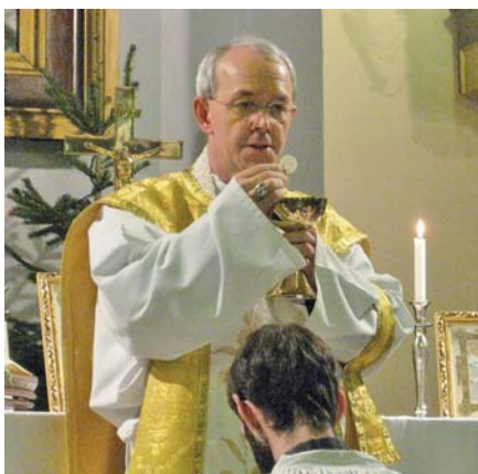
Mons. Athanasius Schneider ORC

Pro tento postoj ducha je rušivým Boží vtělení, reálná přítomnost Boží v tajemství Eucharistie, ústřední místo eucharistické Boží přítomnosti v kostelích. Hříšný člověk totiž chce postavit sám sebe do středu, i v prostoru kostela i při slavení Eucharistie chce být viděn, chce být vnímán. Proto je eucharistický Ježíš, vtělený Bůh, přítomný pod eucharistickými způsoby ve svatostánku, nejraději umisťován stranou. Vadí dokonce obraz Ukřižovaného na krucifixu uprostřed oltáře při celebraci tváří k lidu, protože přece zakrývá obličej kněze. Obraz Ukřižovaného a svatostánek jsou proto stavěny stranou. Účastníci bohoslužby musejí přece neustále vidět obličej kněze