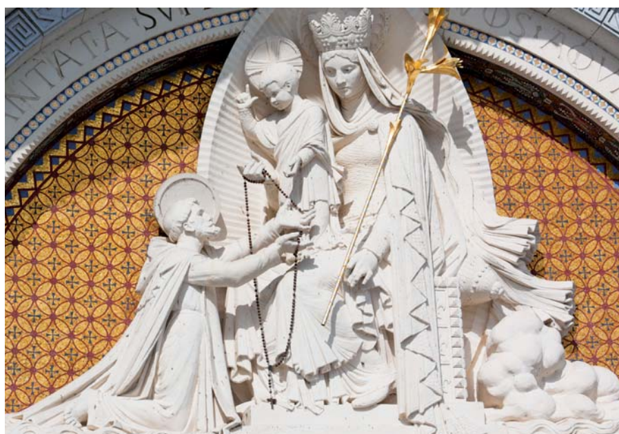
Detail průčelí Růžencové baziliky v Lourdes.

Svatá Panna byla odolná vůči všemu prokletí, a proto požehnaná mezi ženami. Vždyť ona jediná sice podstoupila prokletí, ale přinesla požehnání a otevřela bránu ráje. Proto se k ní hodí jméno Maria, které se vykládá jako „hvězda mořská“. Vždyť tak jako jsou lodi mořskou hvězdou přiváděny k přístavu, tak jsou také křesťané Marií přiváděni ke slávě.