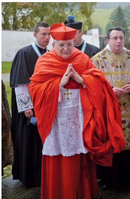
Kardinál Burke na návštěvě ve Vyšším Brodě

Srdcem rodiny musí být víra v Boha. Rodiče musí žít vlastní vírou a učit jí své děti. A pak modlitba – pravidelná společná modlitba ráno a večer, před jídlem, společná modlitba růžence. Všechno dosahuje svého vrcholu v nedělní mši svaté. Dále různé zvláštní pobožnosti – velmi doporučuji zásvětné