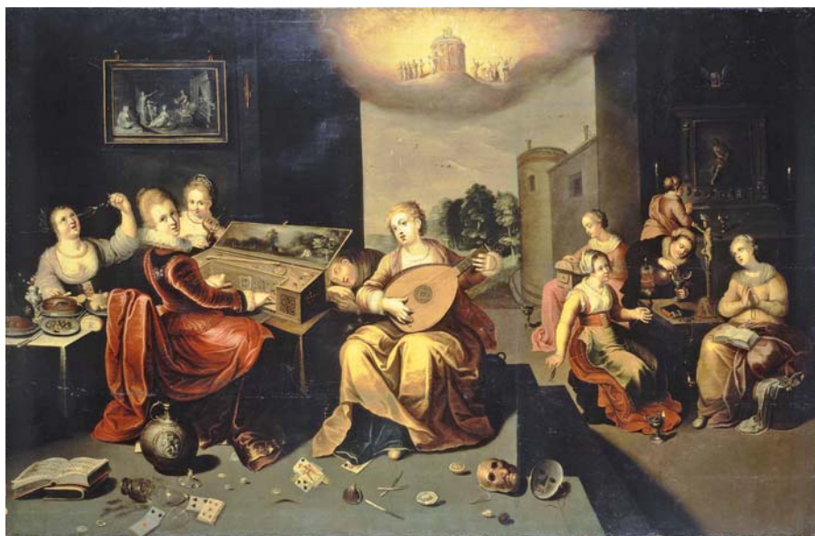
Hieronymus Francken: Podobenství o deseti pannách (1616).

A nemohlo být přikázáno nic, co by se víc podobalo věčnému životu. Vždyť věčný život trvá tím, že se Bůh ve své dobrotě sám dává těm, kdo žijí v nebeské blaženosti.