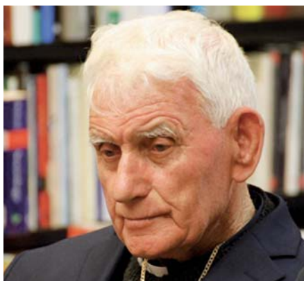
P. Ernest Simoni Troshani