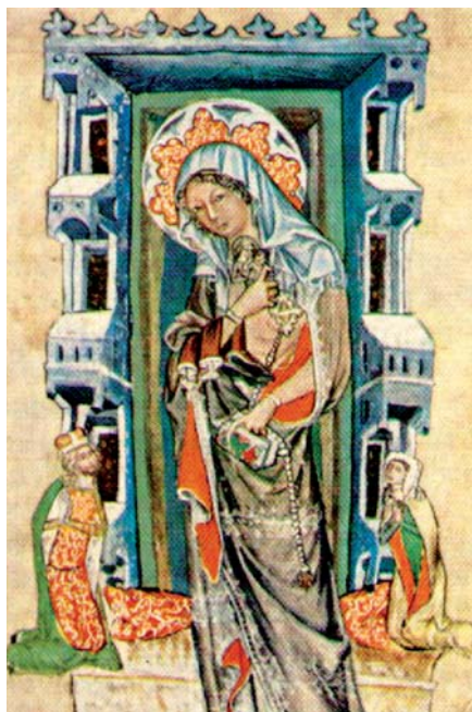
Svatá Hedvika Slezská, miniatura na titulním listu Ostrovského kodexu (1353).

Své místo v Církvi najdeme jistě účastí na bohoslužbách, přijímáním svátostí, četbou Písma svatého, stálým vzděláváním se a poznáváním Božích pravd. Ale především také otevřenými očima, kdy