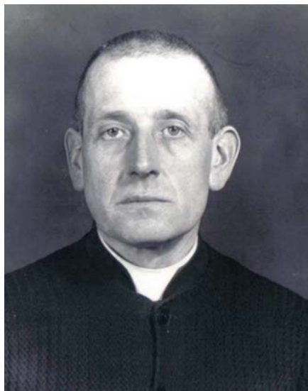
Blahoslavený Michał Kozal

Nakonec došlo i na něho. Nacisté jej internovali nejprve v biskupském síd-