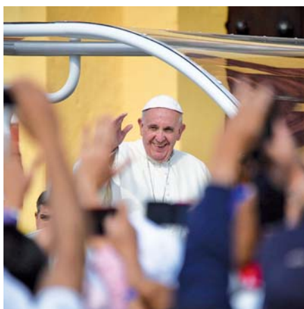
Papež František v San Cristóbal de las Casas