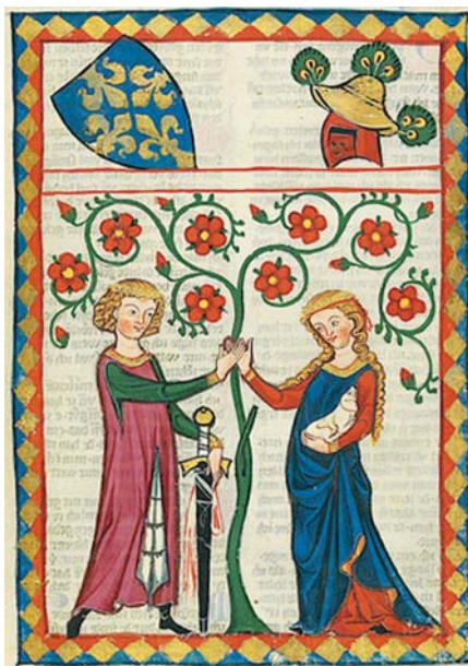
Codex Manesse (14. stol.).

Omezení lidské sexuality na pouhý pramen zábavy má i jiné následky. Když lidé vytěsní ze svého přístupu k sexuální aktivitě plodnost, stává se jejím jediným cílem