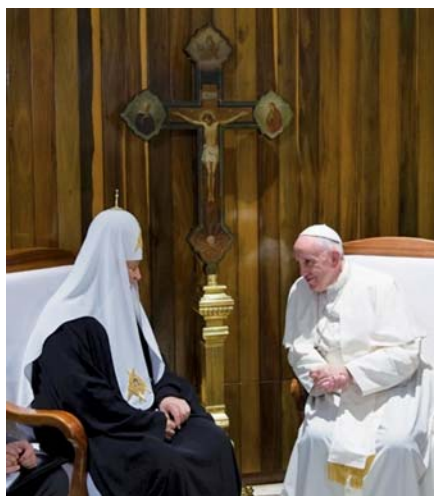
Papež František a patriarcha Kirill.

Navzdory přetrvávajícím překážkám František a Kirill vybízejí křesťany na celém světě, aby s novou horlivostí prosili Pána za plnou jednotu všech jeho učedníků, a vybízejí své souvěrce, aby vydávali společné svědectví evangelia a společně odpovídali na výzvy dnešního světa.