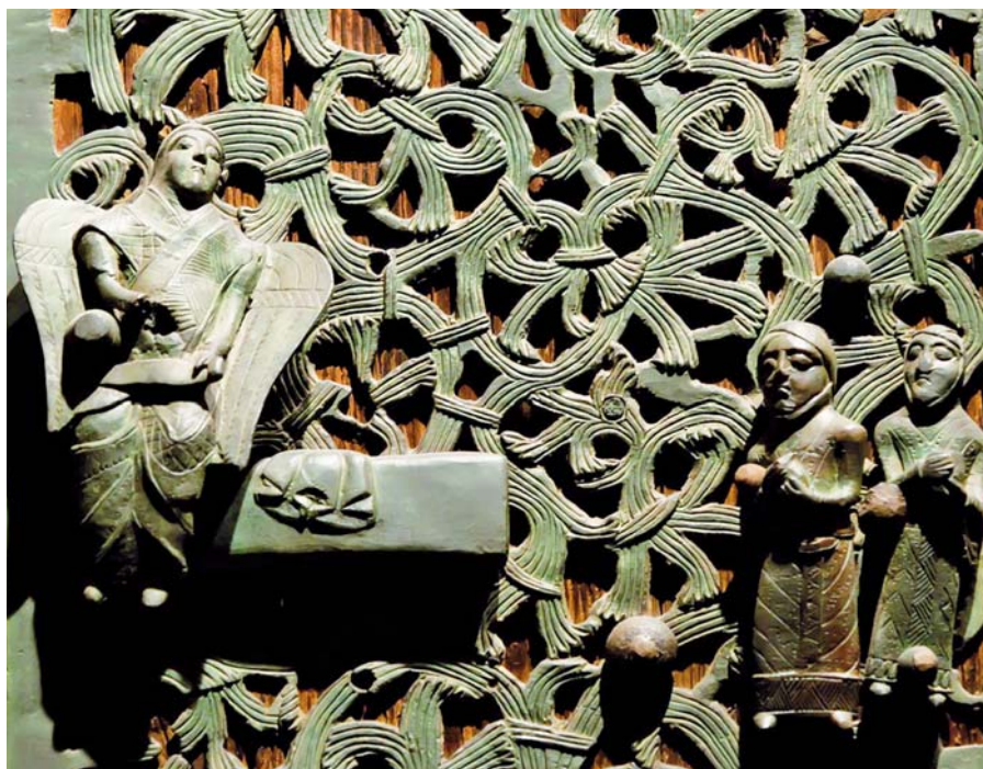
Prázdný hrob, Verona, San Zeno Maggiore (12. stol.).

Snad se pokoušíš chodit, ale nemůžeš, protože tě bolí nohy. Proč tě však bolí? Není to tím, že je chtivost honila cestou necestou? Slovo Boží však uzdravilo i chromé. „Já mám nohy zdravé,“ namítneš snad, „ale nevidím žádnou cestu.“ On však i slepým vrátil zrak.