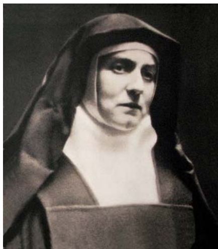
Svatá Edith Steinová.

Za první světové války působila na frontě jako sanitářka, její posádka pobývala nějaký čas i v Hranicích na Moravě. Po válce se opět vrátila do Freiburgu, aby pokračovala v univerzitní kariéře. Jenže setkání s katolickými přáteli změnilo její život. Trpěla duchovní vyprahlostí, ateismus nedokázal naplnit její srdce, podléhala depresím. Filozofický směr fenomenologie, který vyznávala, se pojil mj. i se jménem katolického konvertity