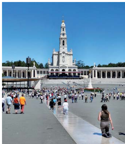
Bazilika Panny Marie Růžencové ve Fatimě

připravují trest. Bůh nás s naléhavostí varuje a volá na dobrou cestu za plného respektování svobody, kterou nám dal; odpovědnost proto nesou lidé sami.“ 5