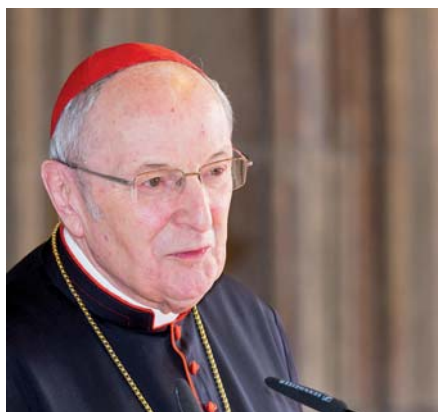
Joachim kardinál Meisner