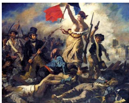
Eugène Delacroix: Svoboda vede lid na barikády (1830)

letí definuje, že indiáni a černoši jsou lidmi na stejné úrovni s bělochy, proto nesmějí být zajímáni jako zvířata a prodáváni do otroctví. 2 Podobně se ve svých dokumentech vyjadřuje v 16. století svatý Pius V. a v 18. století Benedikt XIV.