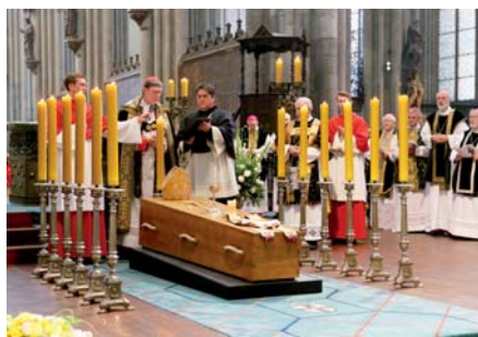
Pohřeb Joachima kardinála Meisnera