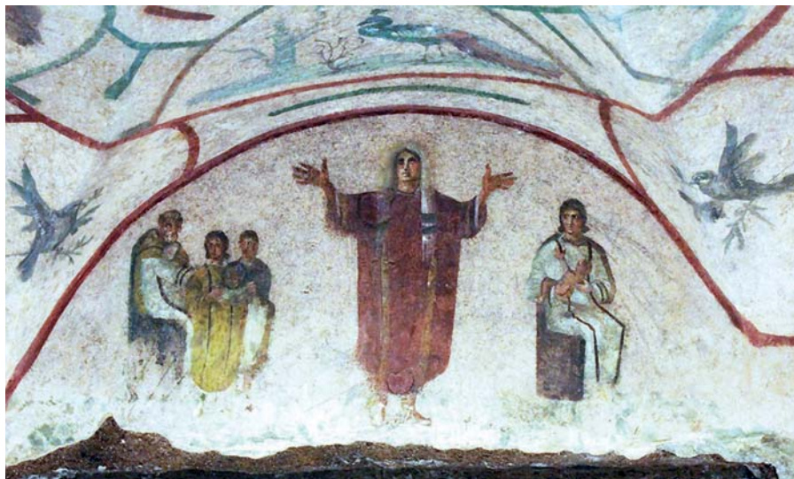
Orant, Priscilliny katakomby.

Homilie papeže Františka při slavnosti svatých Petra a Pavla