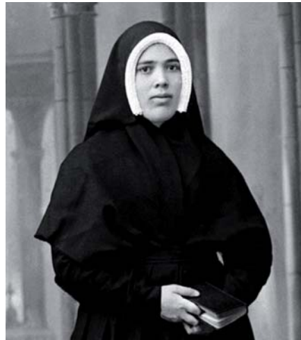
Sestra Lucie z Fatimy.

dal příkaz, abych to nikomu neříkala, a jeho představitel mi nařizuje psát.“ Navíc se několikrát pokoušela tajemství napsat, ale jakási tajemná síla jí v tom bránila, přestože jinak schopná psát byla. Právě pro řešení této situace se dopisem obrátila na valladolidského arcibiskupa. Ten jí po-