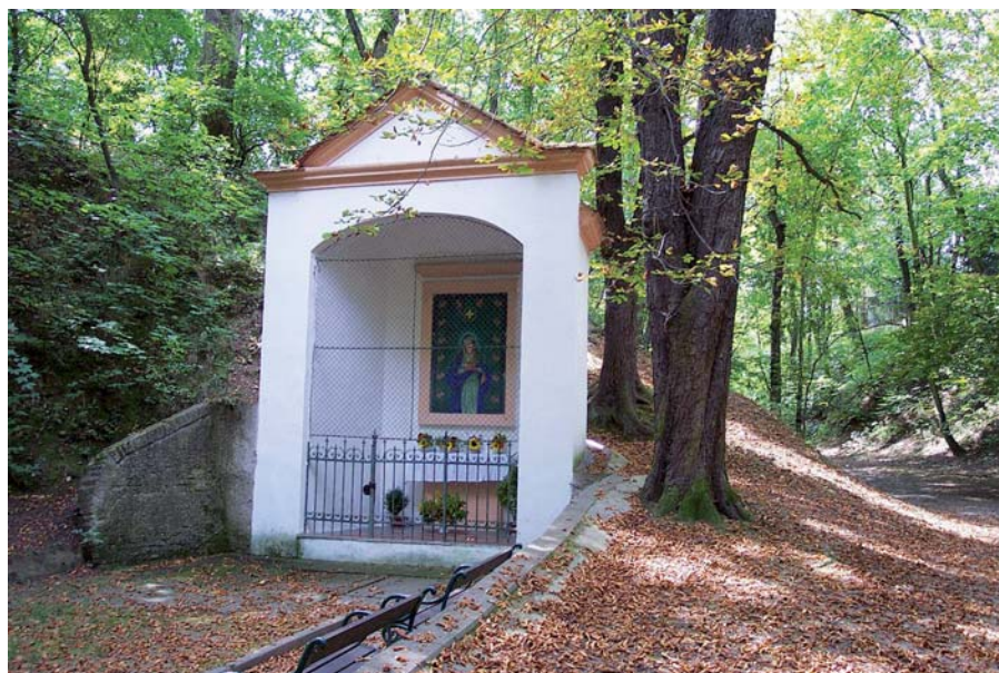
Zařačná studánka v Praze-lysojálkách.

Já však ti chci ukázat, jak Pán mluví k nám. V posledním čase vykonal nové stvoření. Pán praví: Hle, činím poslední věci jako první. Na to poukazoval prorok, když oznamoval: Vejděte do země oplývající mlékem a medem a ovládněte ji. Jsme nové stvoření, jak zase praví ústy jiného proroka: Odejmu z jejich těla srdce kamenné – totiž z těla těch, kteří podle jeho prozřetelnosti obdrželi Božího Ducha – a dám jim srdce z masa. Neboť on sám se chtěl zjevit v těle mezi námi a u nás přebývat. Příbytek našeho srdce, milovaní bratři, je pro Pána svatým chrámem. Vždyť Pán říká opět: Budu tě oslavovat se shromážděním svých bratří a budu ti zpívat žalmy ve shromáždění svatých. Neboť jsme to my, koho uvedl do té dobré země!