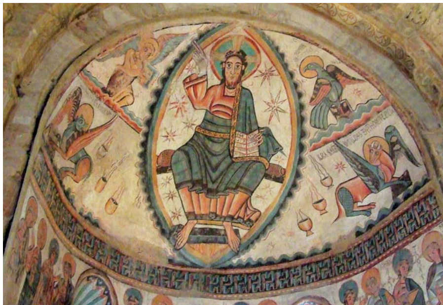
Santa Maria de Mur.

Katecheze papeže Františka na generální audienci