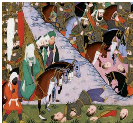
Prorok Mohamed se svoji armádou.

Poslední dvojice je patrně nejlepším argumentem ve prospěch zvýšených obav spojených se šířením mešit. Podle islámského učení na zemi nemůže panovat pokoj, dokud si muslimové nepodrobí nemuslimy. Třebaže ne každý muslim si