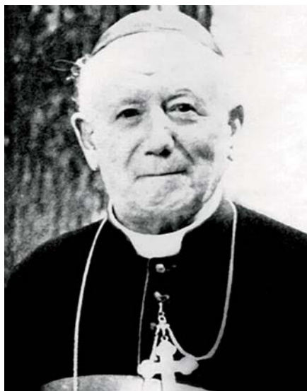
Mons. Jules-Géraud Saliège.

Stovky belgických kněží se ale zapojily do protinacistického odboje a podpory partyzánského hnutí. Za to se ocitli