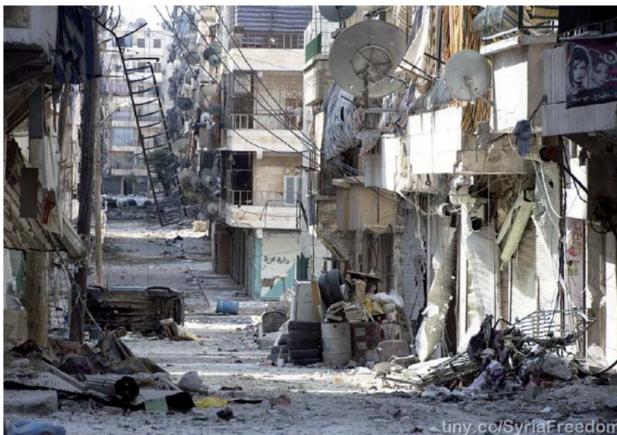
Zničené Aleppo.

v provincii Idlib, aby mohla proběhnout evakuace zraněných a nemocných lidí. Ale na začátku své závazky neplnili.