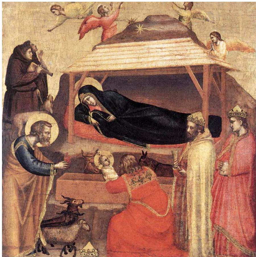
Giotto di Bondone: Zjevení Páně (cca 1325).

Homilie papeže Františka na slavnost Zjevení Páně