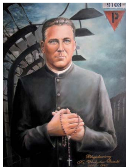
Bl. Władysław Demski.

Odmítli ho dokonce přijmout na nemocniční oddělení. Ponechali jej těžce zraněného a zakrvaveného na ubikaci, kde kápoové pokračovali v krutém bití