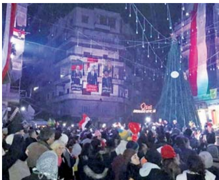
Oslavy v Aleppu.

Kdo jsou odpůrci Asada? Jsou to všechno islámští teroristé?