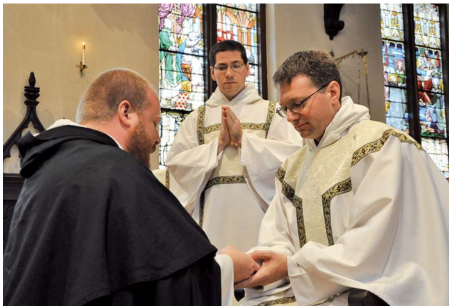
Obřad řeholních slibů.

Kristova oběť na kříži má takové rozměry – samotný vtělený Bůh se obětuje Otci a za nás –, že nemohla nebyť jediná: to na více místech velmi zdůrazňuje list Židům. Zároveň ovšem nemohla a nemůže nebyť znázorňována a zpřítomňována na různých místech a v různých dobách, aby lidé všech dob a míst měli možnost účastnit se jí a přijmout její spásonosné plody. Jak víme, podle Ježíšova moudrého a láskyplného ustanovení při poslední večeři se tak děje skrze oběť mše svaté. Mše svatá je tak podle vyjádření svatého Tomáše Akvinského „názorným obrazem Kristova utrpení“ ( imago repraesentativa