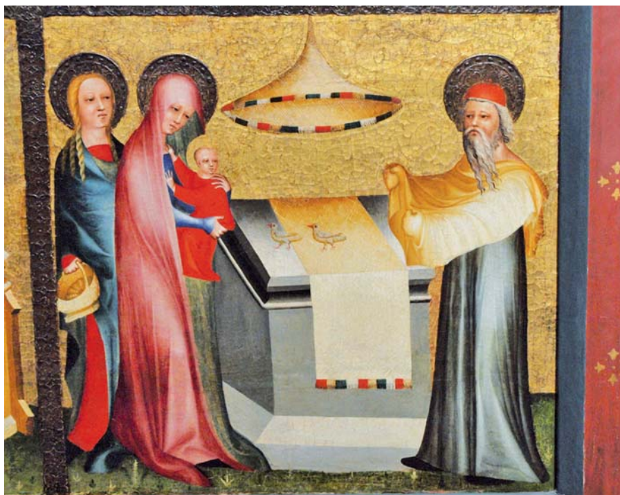
Obětování Páně.

Jelikož jsme byli znovuzrozeni pro budoucnost, nepropadněme dobrou časnému, ale zaměřme se na dobro věčné. A abychom se mohli víc přiblížit k poznání své naděje, uvažujme o tom, co naší přirozenosti dala Boží milost. Slyšme, co říká apoštol: Jste už přece mrtví a váš život je s Kristem skrytý v Bohu. Ale až se ukáže Kristus, váš život, potom se i vy s ním ukážete ve slávě. S tím, který žije a kraluje s Otcem a Duchem Svatým po všechny věky věků! Amen.