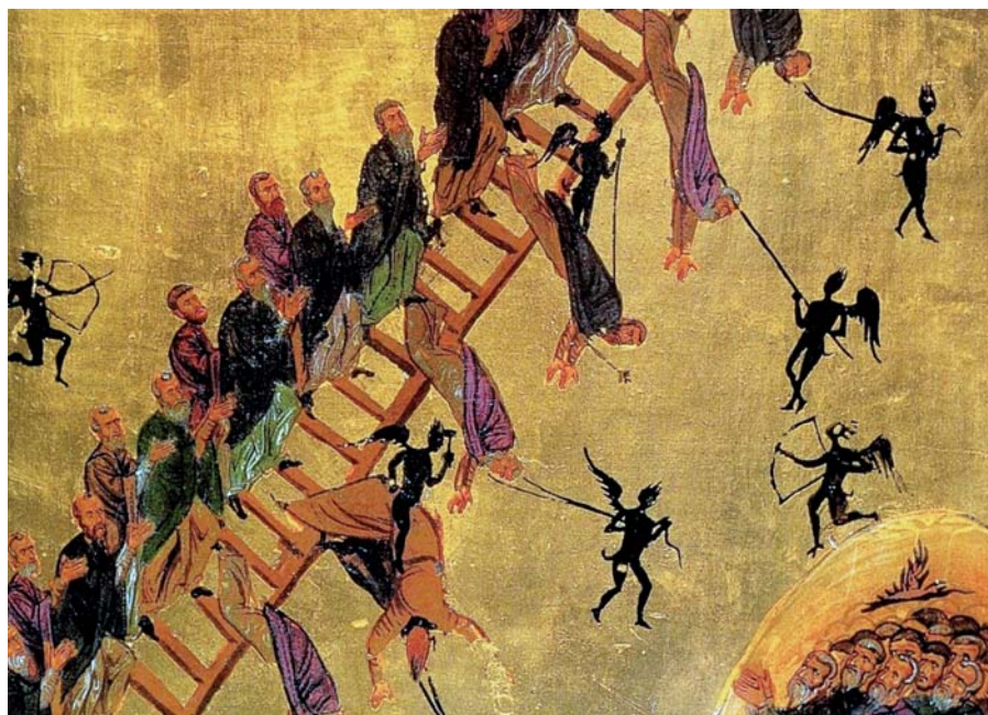
Žebřík do nebe (žebřík Jana Klímaka), detail ikony, 12. století, Sinaj.

Po této slávě tedy bezpečně dychtíme s celou ctižádostí. Abychom směli v tuto slávu doufat a ucházet se o tak velikou blaženost, k tomu je ovšem třeba velice toužit také po pomoci svatých, aby nám bylo dáno na jejich přimluvu, čeho nemůžeme sami dosáhnout.