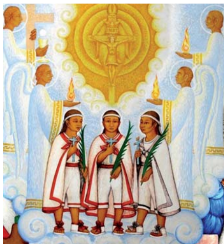
Svatí Cristobal, Antonio a Juan.