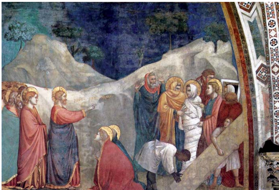
Giotto di Bondone: Vzkříšení Lazara (1320).

Katecheze papeže Františka na generální audienci