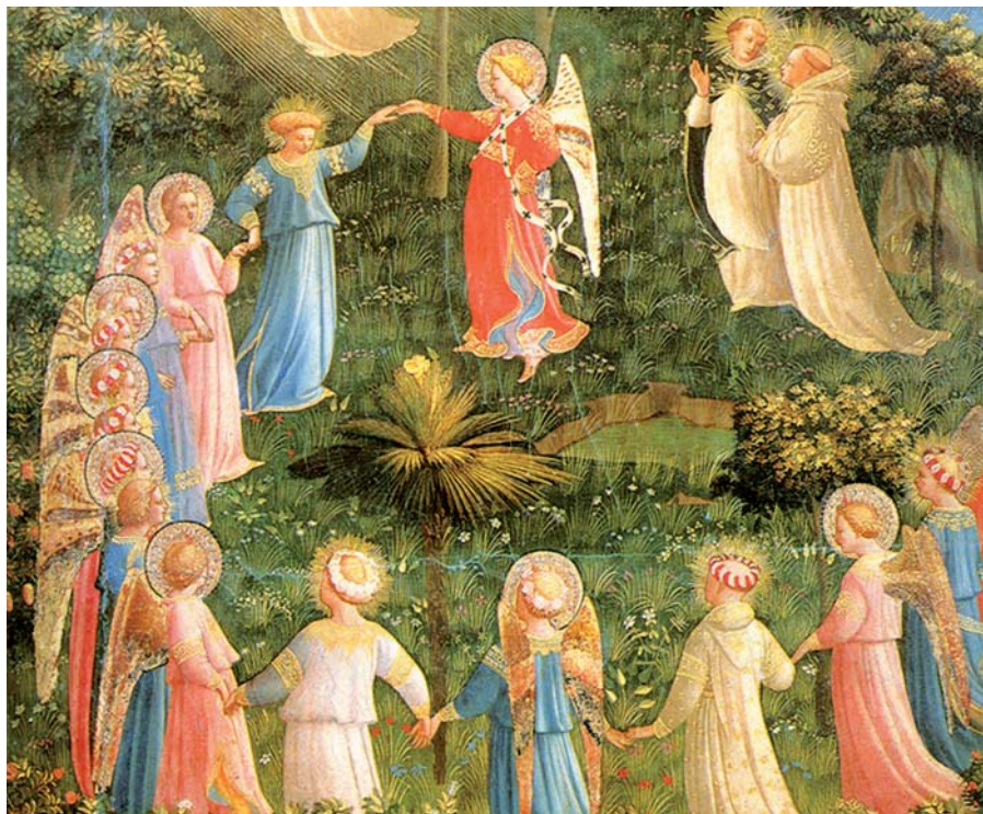
Fra Angelico: Poslední soud, detail (cca 1435).

Katecheze papeže Františka na generální audienci