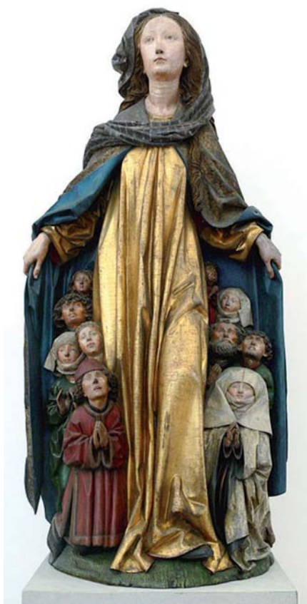
Michel Erhart: Matka milosrdenství (cca 1490)

Situace obrany v akutním nebezpečí jen málo odpovídá zkušenostem z vojenské služby na straně Varšavské smlouvy. Vojenská příprava pro případ teroristického útoku by přitom nemusela být časově náročná. Ostatně by bylo možné