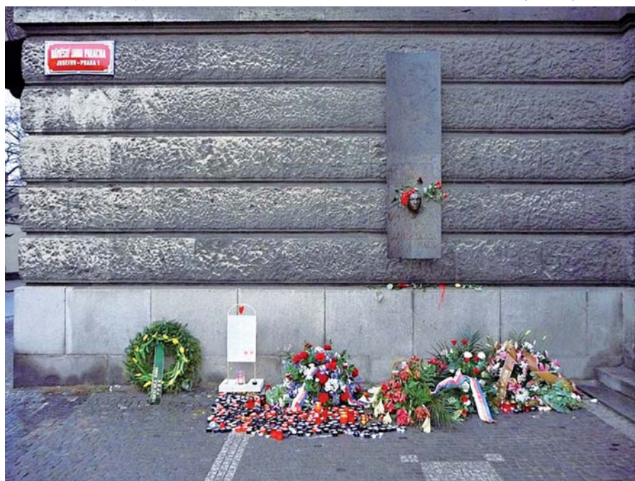
Pomník Janu Palachovi na Palachově náměstí v Praze.

Přidám osobní vzpomínku na drobnou epizodu oněch událostí. My, kdo jsme tehdy vedli studentské hnutí, jsme v oněch dnech prakticky permanentně