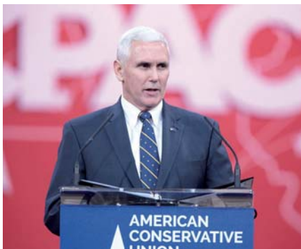
Mike Pence.