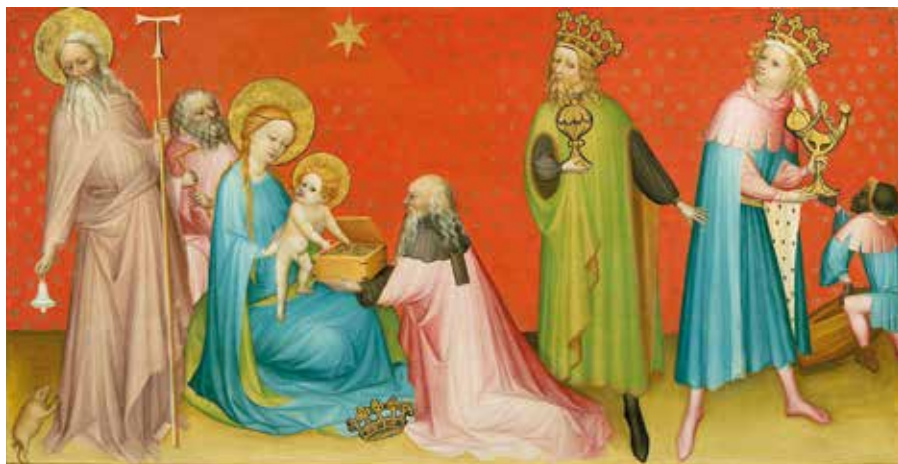
Klanění tří králů (kolem 1400).

Homilie papeže Františka při mši svaté o slavnosti Matky Boží, Panny Marie