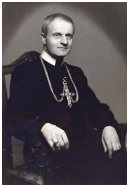
Blahoslavený Peter Pavol Gojdič

Ustaša, která sice neměla katolicismus ve svém programu, nicméně ostentativně ho zdůrazňovala jako znamení, jímž se Chorvaté liší od pravoslavných Srbů. Ustašovci prováděli etnické čistky, vraždili srbské, židovské a romské obyvatelstvo. Smutné je, že na těchto masakrech se někdy podíleli i katoličtí duchovní, svedeni primitivním šovinismem. Rubem této pravdy ovšem je, že srbské monarchistické oddíly tzv. četníků si počínaly úplně