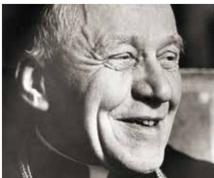
Josef kardinál Beran.