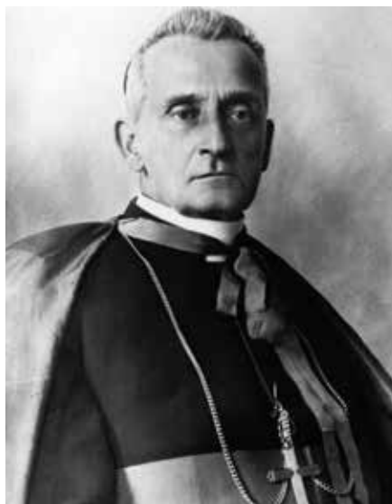
Adam Stefan Sapieha.

Tři roky poté vypukla první světová válka. Tehdy bylo Polsko na více než sto let rozděleno mezi tři jeho silné sousedy – Rusko, Prusko a Rakousko. Tyto mocnosti spolu válčily a Polsko se často stávalo jejich bojištěm. Arcibiskup Sapieha jako pravý humanista v roce 1915 vytvořil „Knížecko-biskupský výbor“ ( Książęco-Biskupi Komitet ) na pomoc