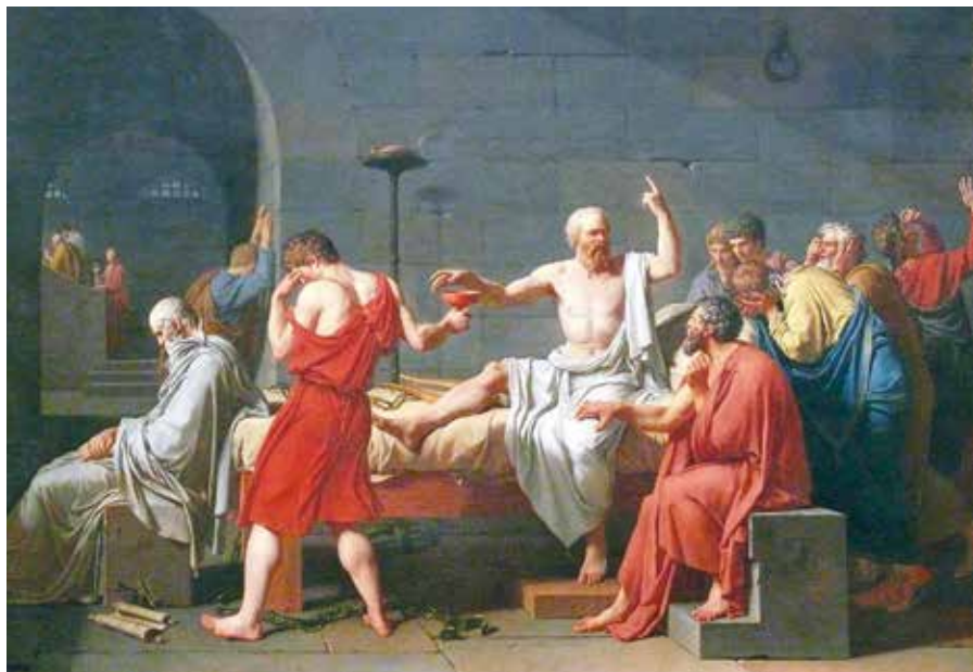
Jasques Louis David: Smrt Sokrata (1787).

F: Naivní? Proč naivní? Naopak. Nebyl natolik naivní, aby si myslel, že osud člověka kopíruje osud jeho těla. To jistě zaniká, ale lidské bytí není totožné s jeho tělesností. Redukce života na jeho materiální projevy je nepřijatelná. Nelze ji podpořit žádnou empirickou zkušeností. Nebo jsi snad schopen zkušenostně doložit, že jen ty znaky, které jsou na člověku zkušenostně dostupné, tvoří vlastní podstatu jeho života?