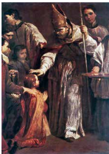
Giuseppe Maria Crespi: Biřmování (1712)

Biřmování je vtaženo do dynamiky tzv. iniciačních svátostí v pořadí křest – biřmování – Eucharistie. Pravzor logické návaznosti těchto svátostí podávají mystagogické katecheze velkých patristických autorů, zaznamenané ve formě zpětných poučení neofytů o smyslu přijetí těchto svátostí. Mystagogie, doslova uvedení do tajemství, navazuje na prožitek vykonaných svátostných obřadů, jejichž smysl není nově pokřtěným předem vysvětlován. Teprve jejich prožitá zkušenost pak disponuje pokřtěné k následnému pochopení toho, co Bůh v nich svojí milostí způsobil. Proslulé katecheze Cyrila Jeruzalémského († 387) nejprve ilustrují návaznost biřmování na křest podle vzoru samotného křtu Páně: „On, když se umyl v řece Jordán a pleť předala vodám božství, vystoupil z nich a Duch Svatý na něho bytostně sestoupil. Podobně spocínulo na podobném. I vám (se dostalo) pomazání podobně – když jste vystoupili z koupele posvátných proudů, byli jste pomazáni antitypem tohoto pomazání Kristova.“ 1 Dověšením křesťanské iniciace po přijetí prvních dvou svátostí je pak jejich účast na posvátné liturgii a přijetí Eucharistie: „Nyní, když jsi svlékl starý