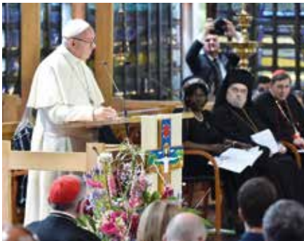
Svatý otec v Ženevě.