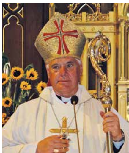
Gerhard kardinál Müller

Hodně se mluví o tom, že význam kongregace je za tohoto pontifikátu umenšován, a že je dokonce izolována. Svatý otec místo ní dává přednost svým poradcům, jako je jeho blízký důvěrník arcibiskup Victor Fernandez, rektor Papež-