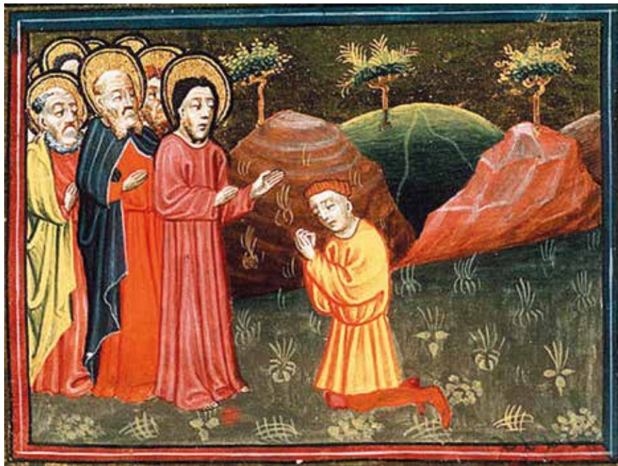
Ježíš a bohatý mládenec (1430).

Katecheze papeže Františka na generální audienci