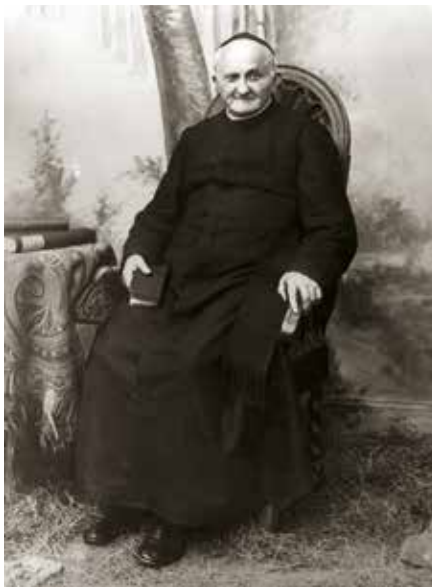
Svatý Arnold Janssen.

Po 12 letech práce na gymnáziu rezignoval na tuto službu, aby se mohl naplno věnovat apoštolátu. Začal vydávat časopis „Malý posel Srdce Ježíšova“, ve kterém už přímo propagoval misijní myšlenku (vnitřní misie) a vzbuzoval nadšení věřících pro světové misie. Tehdy neexistoval v německých zemích žádný misijní institut – ani diecézní, ani řeholní. Díky svému zápalu procestoval všechny