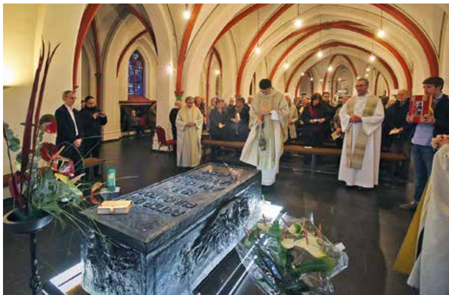
Šteylští misionáři u hrobky Arnolda Jansseny.

Arnoldovou vlastností bylo usilovné hledání Boží vůle, někdy velmi zdoluhavé. Jakmile se však jednou přesvědčil, že je něco vůlí Boží, neměl už ani nejmenší pochybnost, že je třeba to vykonat. Z malého domu, bývalého hostince, vyrostl obrovský komplex. Ještě za života vyslal své misionáře na všechny kontinenty – první do Číny. Osobně vyslal do světa 800 misionářů (333 kněží, 187 bratrů, 301 sester).