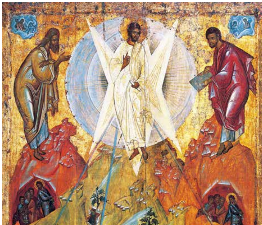
Theofanis Řek : Proměnění Páně (15. stol.).

Co, prosím vás, bratři, chcete anebo co hledáte, když přicházíte do kostela? Co jiného než milosrdenství? Dávejte tedy to pozemské a dostanete to nebeské. Od tebe žádá chudý, a ty žádáš od Boha. Chudý chce kus chleba, ty věčný život. Dej žebračkovi, abys zasluhoval dostat od Krista. Slyš, jak on sám říká: Dávejte, a dostanete.