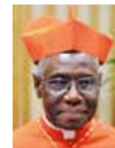
Robert kardinál Sarah, prefekt Kongregace pro bohoslužbu a svátosti

Vraťte se ke Zdroji! Postavte Boha do středu celého svého života. Zakusíte tu jedinou radost, která nikdy neskončí.