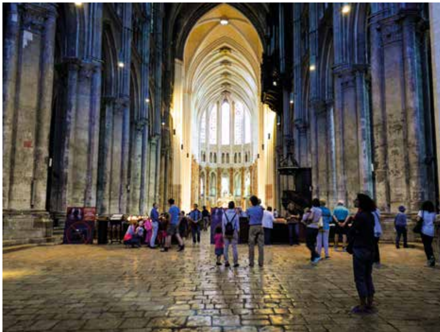
Katedrála Notre-Dame v Chartres.

Bratři, rozhodněte se, že se k němu budete obracet každý den! V tuto chvíli