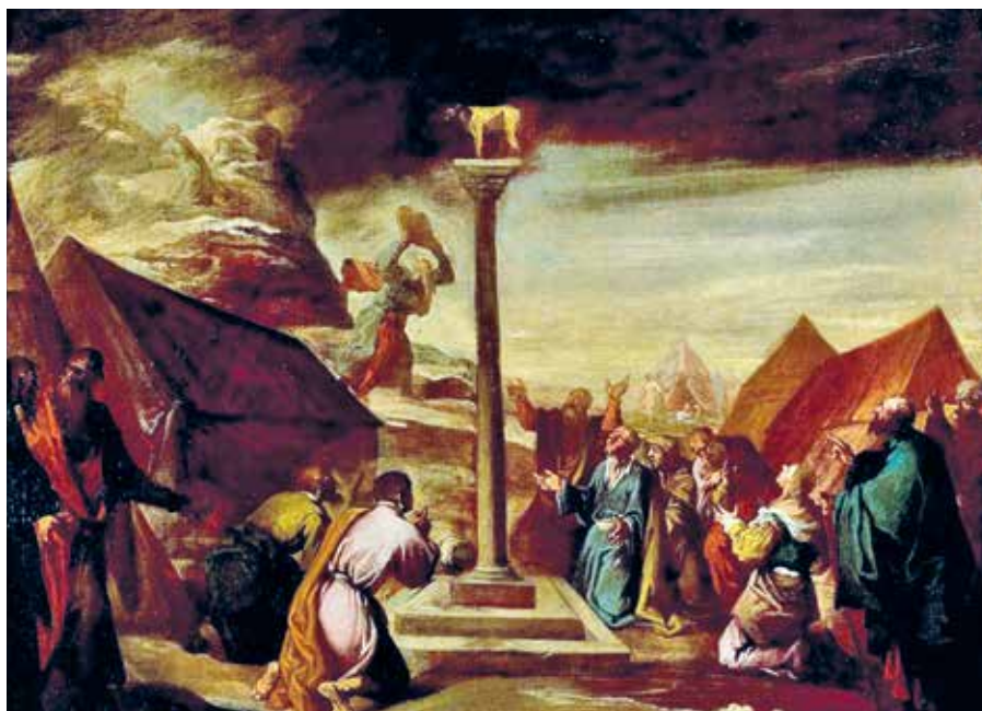
Esteban March: Zlaté tele (17. stol.).

Promluva papeže Františka na generální audienci