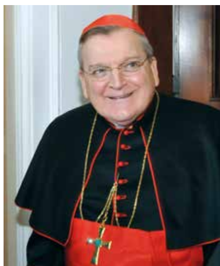
Kardinál Burke.

Kardinál Burke v přítomnosti dalšího spoluautora dubií kardinála Carla Caffarry, známého kazašského biskupa Athanasia Schneidera a více než stovky představitelů prolife a prorodinných organizací z 20 zemí ve všestranném projevu na téma „Fatimské tajemství a nová evangelizace“ prohlásil, že vítězství Neposkvrněného Srdce Panny Marie bude znamenat mnohem více než ukončení světových válek a přírodních katastrof, které předpověděla Panna Maria ve Fatimě.