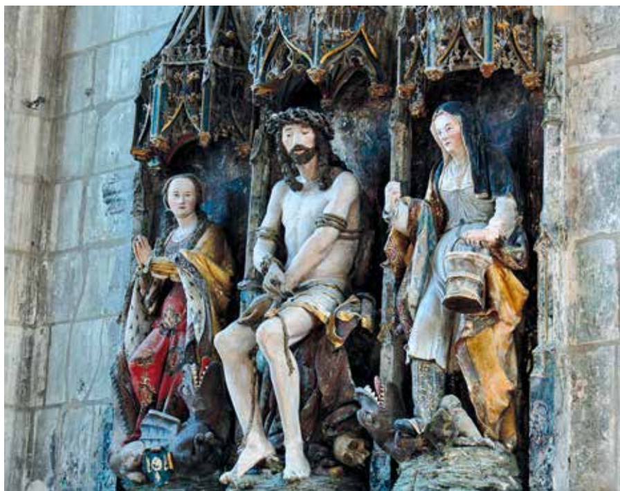
Jean Le Pot: Oltář sv. Marty, St. Étienne, Beauvais (16. stol.).

Ve městě Pána zástupů, ve městě Boha našeho. Tam jsme slyšeli a tam jsme uviděli. Bůh mu dává věčné trvání. At' se nevynásí nikdo, kdo říká: Tady je Kristus, nebo: Tam je; kdo to říká, svádí k rozdělení. Bůh však zaslíbil jednotu; králové jsou spojeni vjedno, ne rozdělení roztržkami. Že by toto město, které zahrnuje celý svět, mohlo být někdy vyvráceno? Kdepak: Pán zbudoval je na věky. Když je Bůh upevnil navěky, proč se bojíš, že by nebeská klenba mohla spadnout?