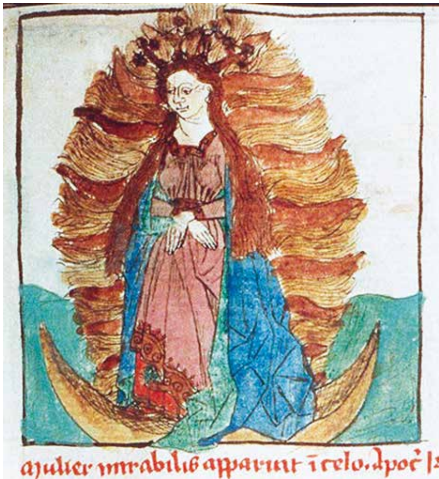
Anonymi: Žena oděná sluncem (1450).

Toto zářivé světlo vycházející z Panny Marie jistě odkazuje na tábořské světlo: na proměnění Pána Ježíše Krista na hoře Tábor, kdy „jeho tvář zazářila jako slunce a jeho oděv zbělel jako světlo“ (Mt 17,2). A také odkazuje na vyjádření knihy Zjevení sv. Jana: „Pak se objevilo na nebi veliké znamení: žena oděná sluncem,