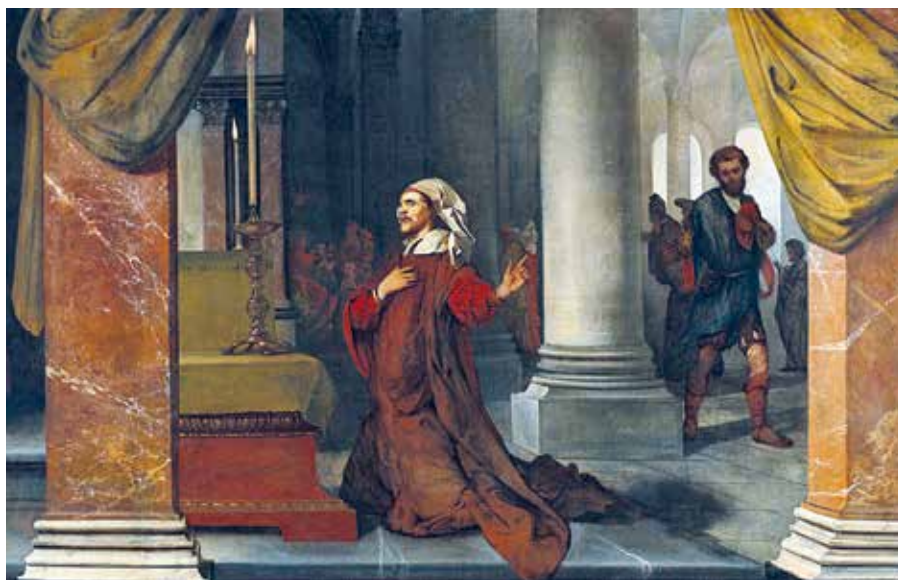
Barent Fabritius: Farizeus a celnik (1661).

Katecheze papeže Františka na generální audienci