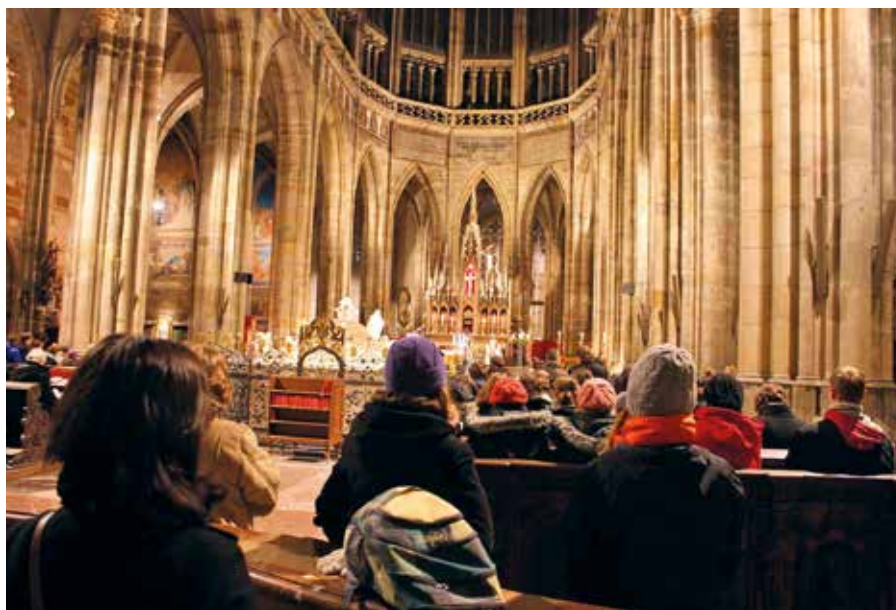
Bořaty v katedrále svatého Vítka, Václava a Vojtěcha.

Otevři, blahoslavená Panno, srdce víře, ústa vyznání, lůno Stvořiteli. Hle, ten, po němž touží všechny národy, klepe venku na dveře. Co kdyby pro tvé meškání přešel, a ty bys znovu musela s bolestí hledat toho, kterého tvá duše miluje? Vstaň, běž a otevři! Vstaň vírou, běž zbožností, otevři vyznáním. A řekla: Jsem služebnice Páně: at' se mi stane podle tvého slova!