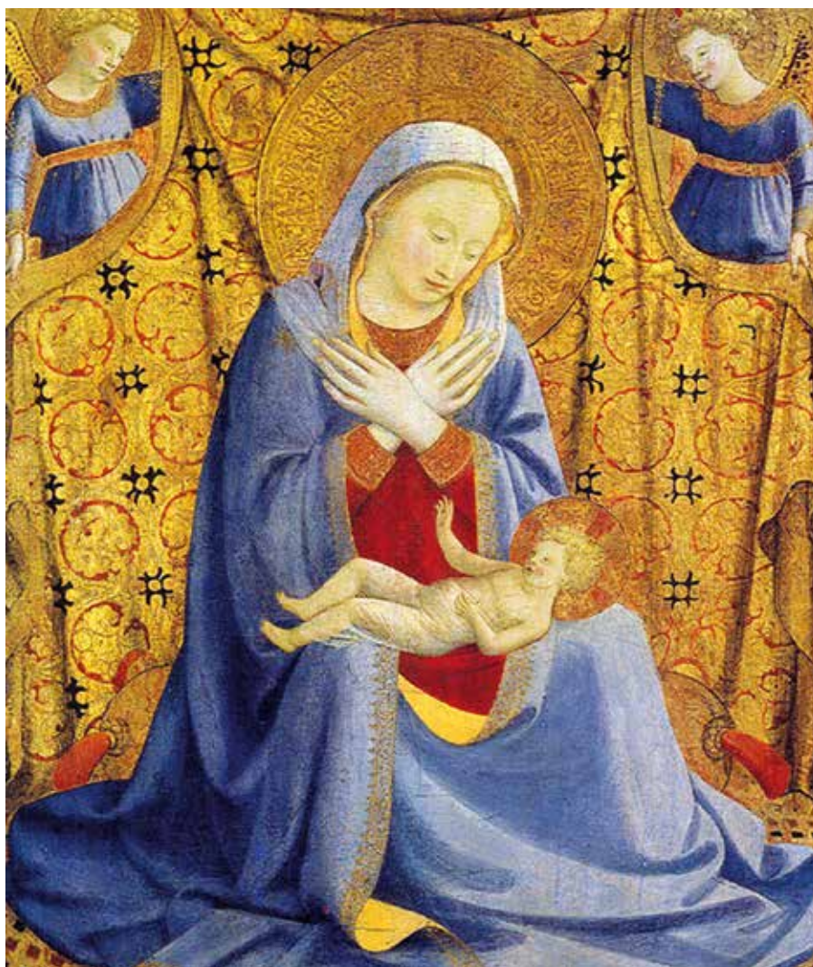
Fra Angelico: Madona pokory (cca 1430).

nis. Jeho signaturami byly a jsou dnes všeobecně rozšířený mravní relativismus a konzumistický hédonismus, od toho se odvíjí celá tzv. postmoderna 21. století.