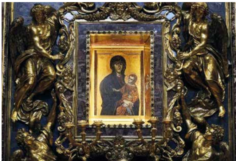
Ikona Salus Populi Romani .

Homilie papeže Františka při mši svaté na svátek Přenesení ikony Salus Populi Romani