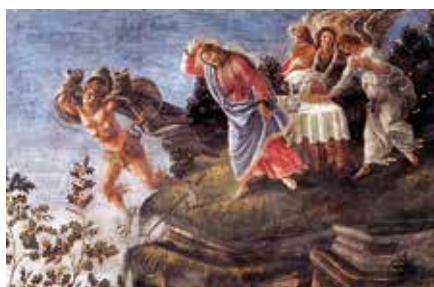
Sandro Botticelli: Pokušení Krista, detail (1473–1481)

Třebaže však nabízí dialog, ďábel nechce, aby byl člověk svobodný, nýbrž usiluje o jeho zotročení. Ďábel chce člověka o svobodu připravit. Chce po něm, aby popřel Boží přikázání, a svobodně tak sám sebe připravil o svobodu. Ďábel při-