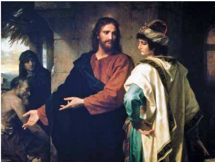
Heinrich Hofmann: Ježíš a bohatý mládenec (1889).

P. James Martin SJ si (na své facebookové stránce) postěžoval, že tato vyhláška „diskriminuje“ lidi s homosexuální orientací, protože nezahrnuje heterosexuály, kteří hřeší, byť třeba ne v oblasti sexuality. Dále ohledně podávání eucharistie lidem žijícím v homosexuálním „manželství“ nedávno řekl v rozhovoru pro The New York Times, že „téměř každý žije nemravným životním stylem“. Jak na to odpovíte?