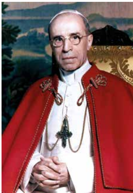
Papež Pius XII.

1. září 1939 vypukla válka. Již v říjnu vydává Pius XII. encykliku Summi Pontificatus , která odsuzuje její rozpoutání. Papež v tomto dokumentu vyjadřuje také svůj soucit a sepětí s napadeným polským národem. Odvolává se na novozákonní citát „zde už není Řek, ani