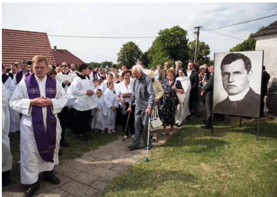
Uložení ostatků P. Josefa Toufara, Číslo 13. července 2015

Jsi zde tedy zván, abys vždycky hleděl k východu, kde ti vychází Slunce spravedlnosti a kde se ti vždycky rodí světlo. Abys totiž nikdy nechodil ve tmě a aby tě poslední den nezastihl v temnotách. Aby se k tobě nevrátila noc a mrak nevědomosti, ale abys vždy žil ve světle vědění, abys měl pořád jasný den víry a stále setrval ve světle lásky a pokoje.